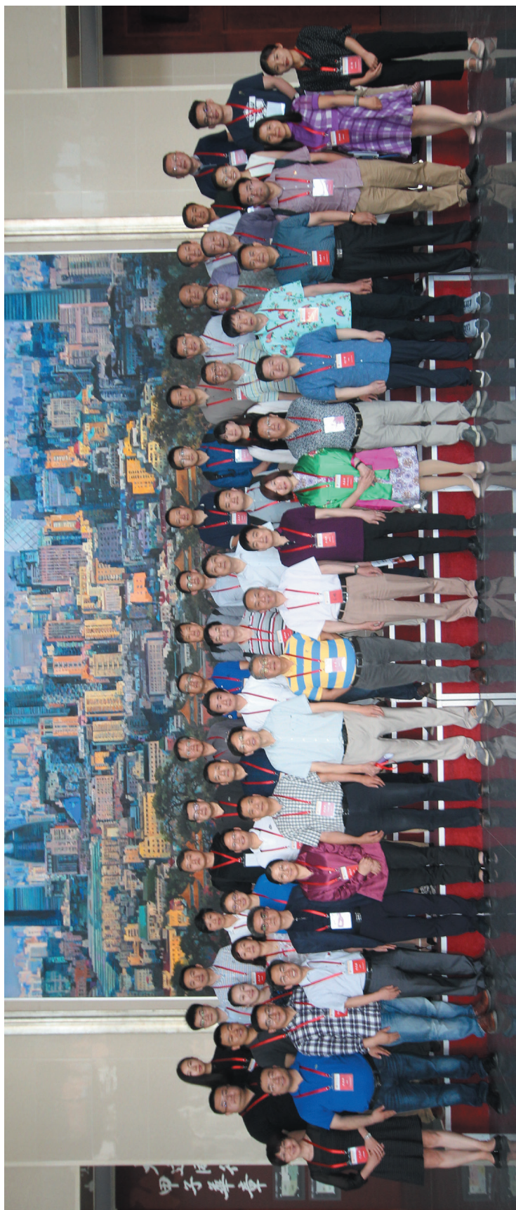
校友会第三届理事会第二次会议部分参会人员合影