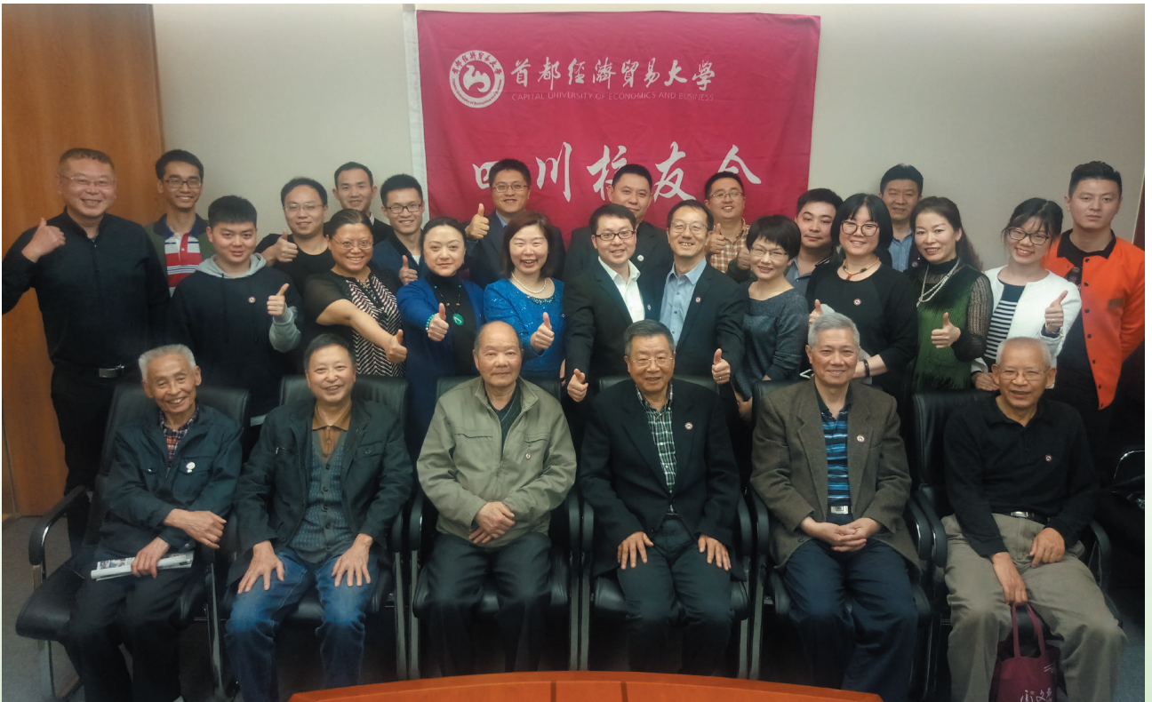
四川校友会部分校友合影