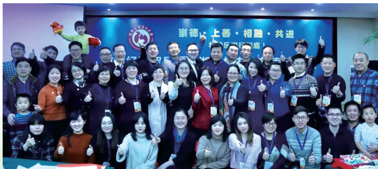
浙江校友会新春联谊会参会人员合影