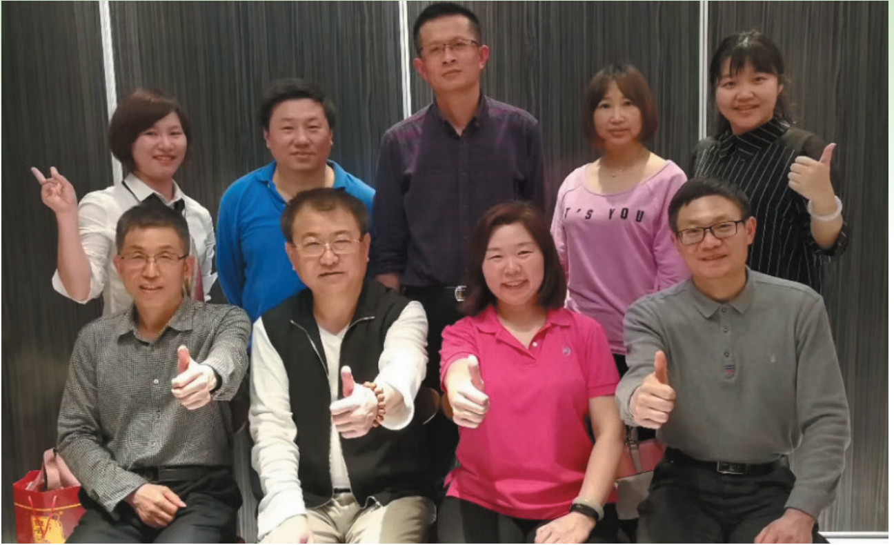
湖北校友会筹备会参会人员合影