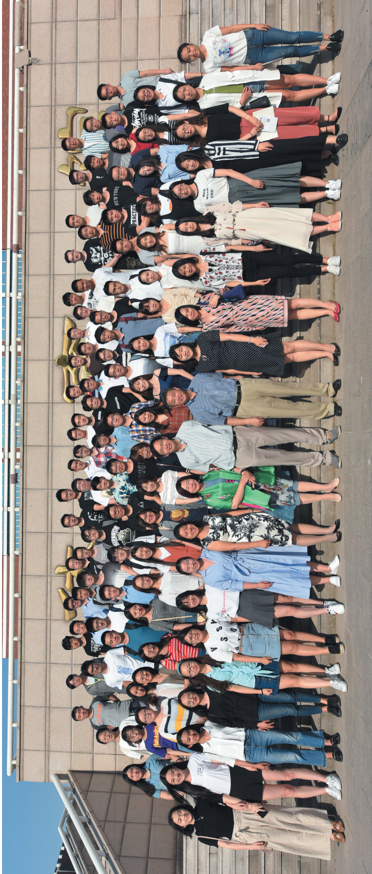
2018届毕业生校友联络员合影