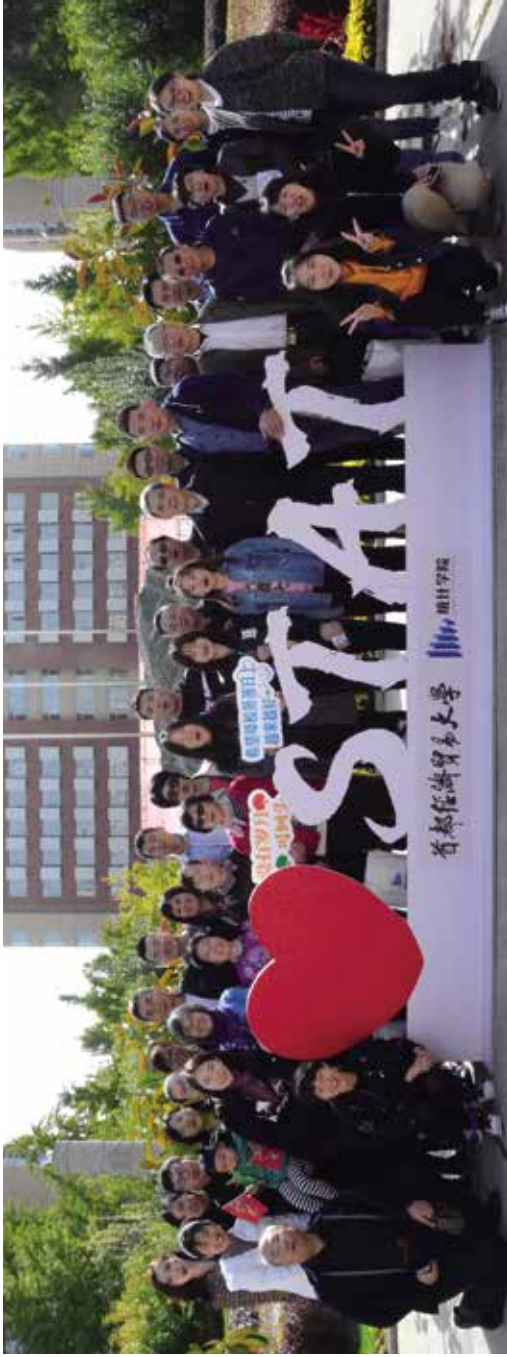
统计学院部分校友合影