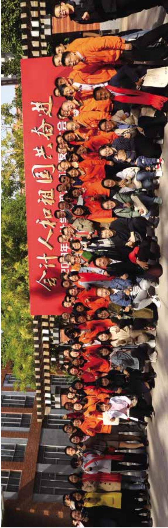
会计学院部分校友合影