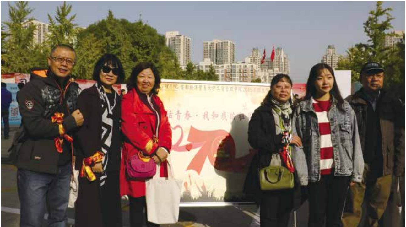
85级商业经济专业班部分校友合影