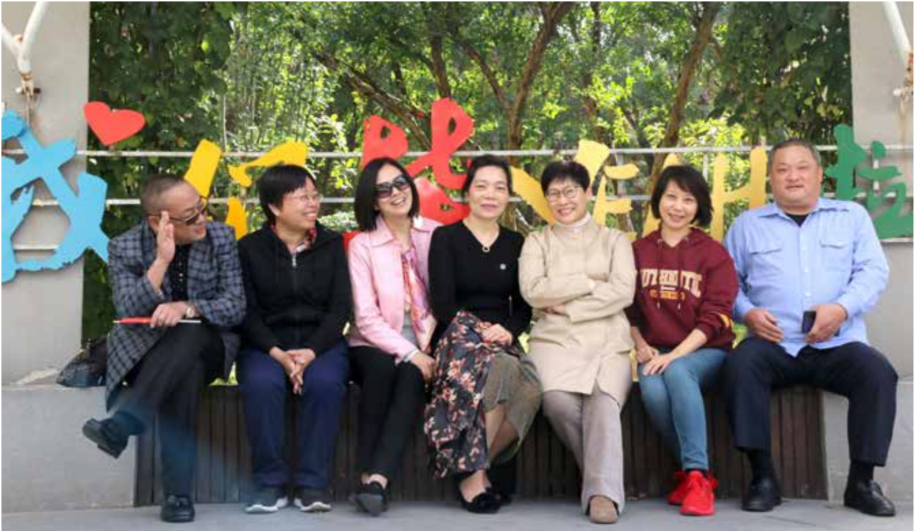
经济学院部分校友合影