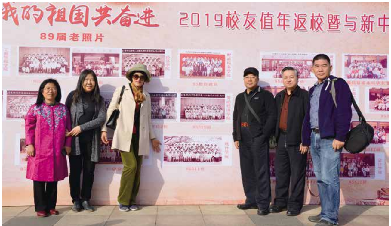
原统计系85511班部分校友合影