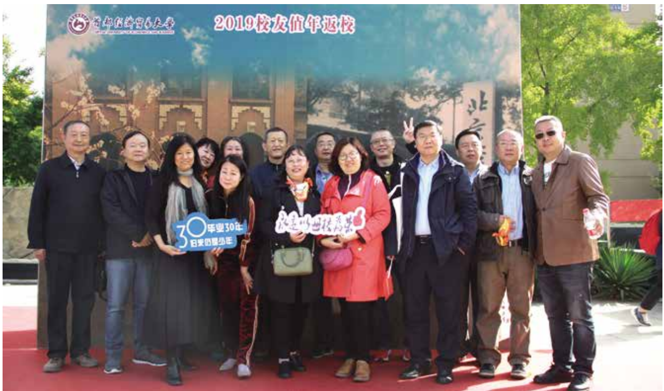
85级市场营销专业班部分校友合影