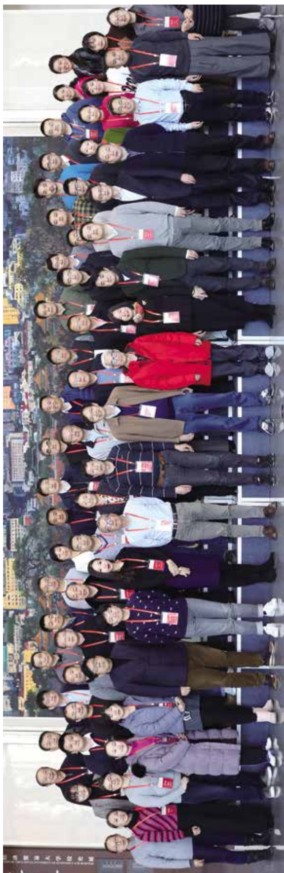
校友会第三届理事会第二次会议与会人员合影