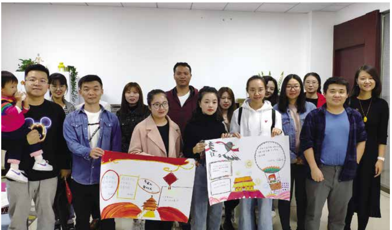
外国语学院部分校友合影