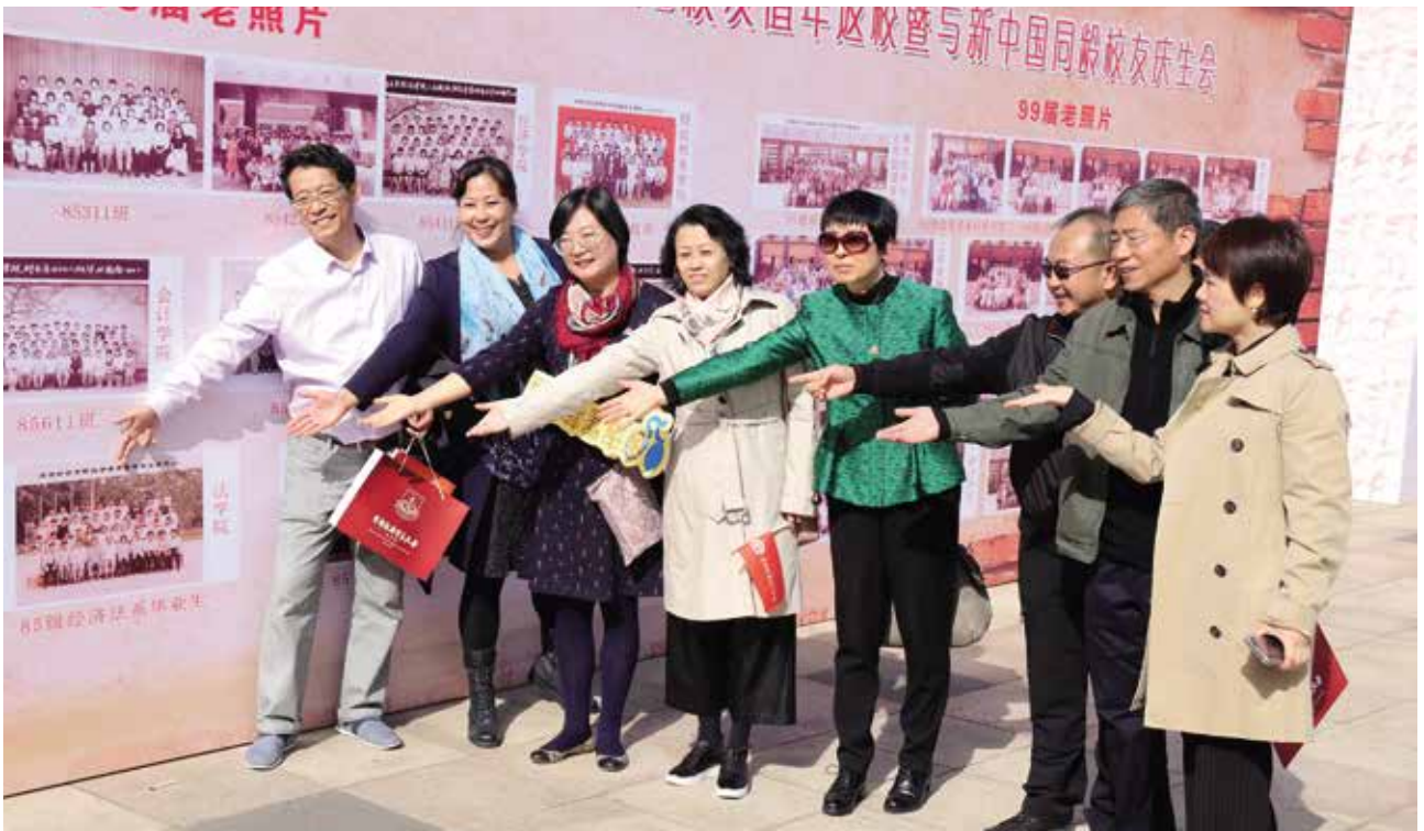
原经济法系85级部分校友合影