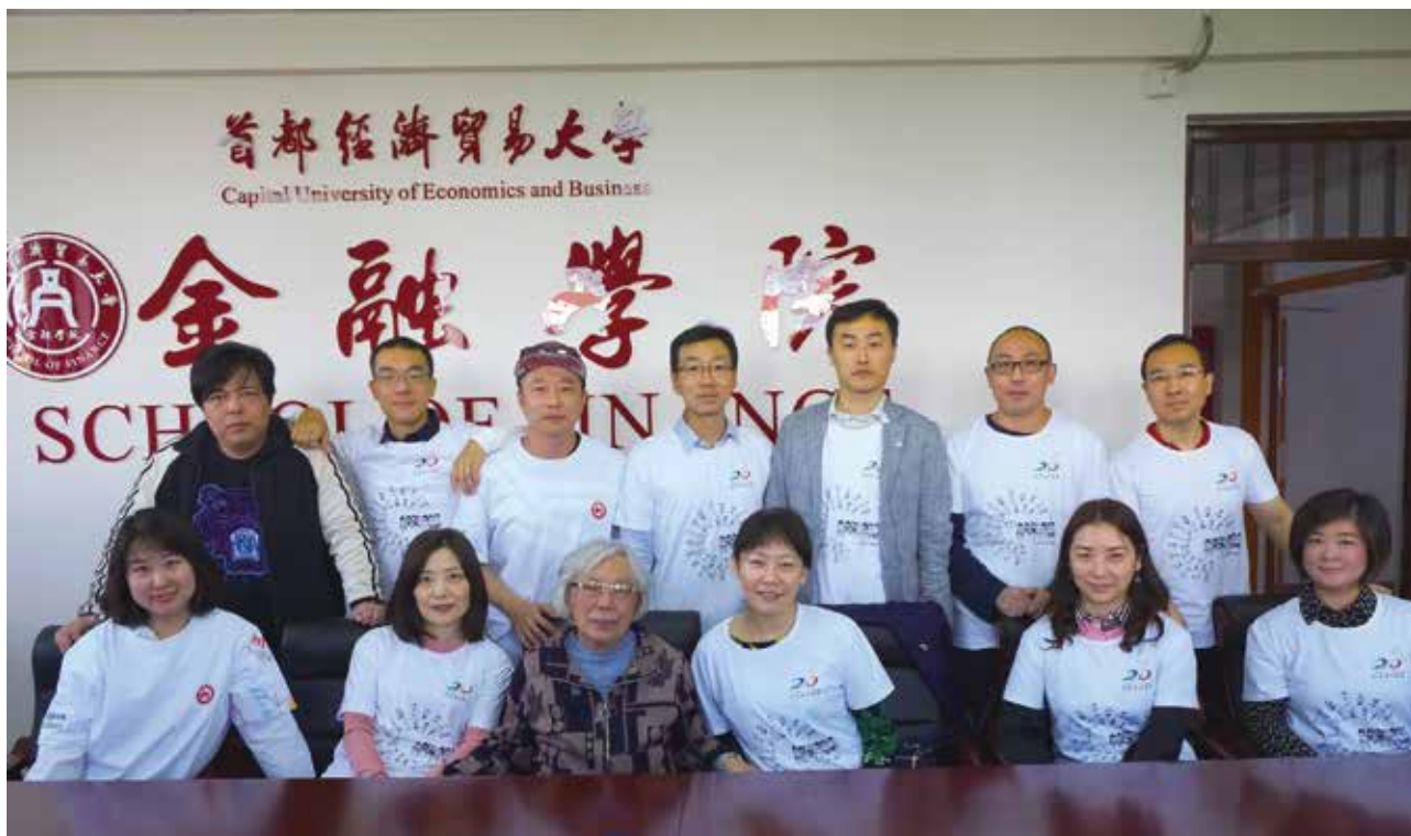
95级国际金融学专业部分校友合影