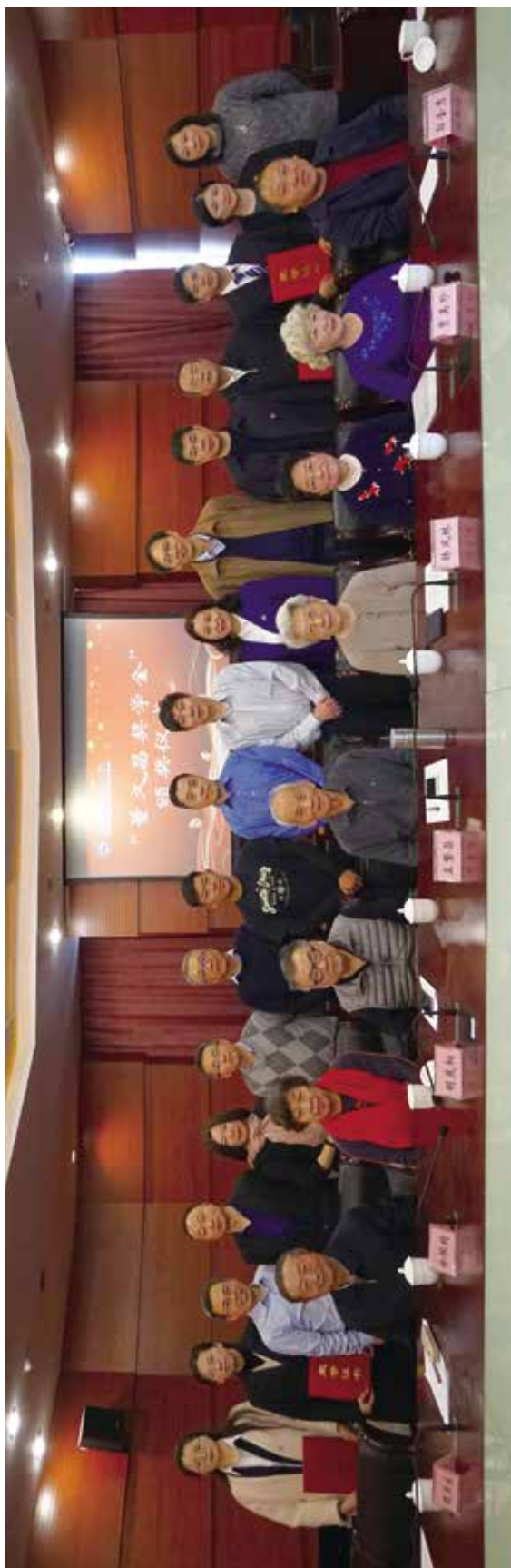
“董久昌奖学金”颁奖仪式部分与会人员合影