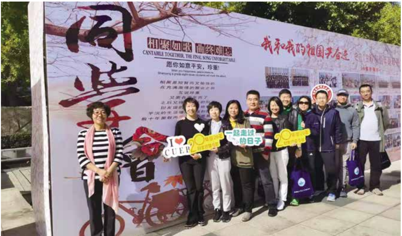
原经济系95311班部分校友合影