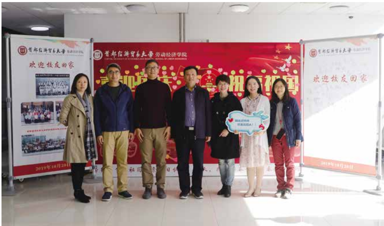
原劳动经济系8521班部分校友合影