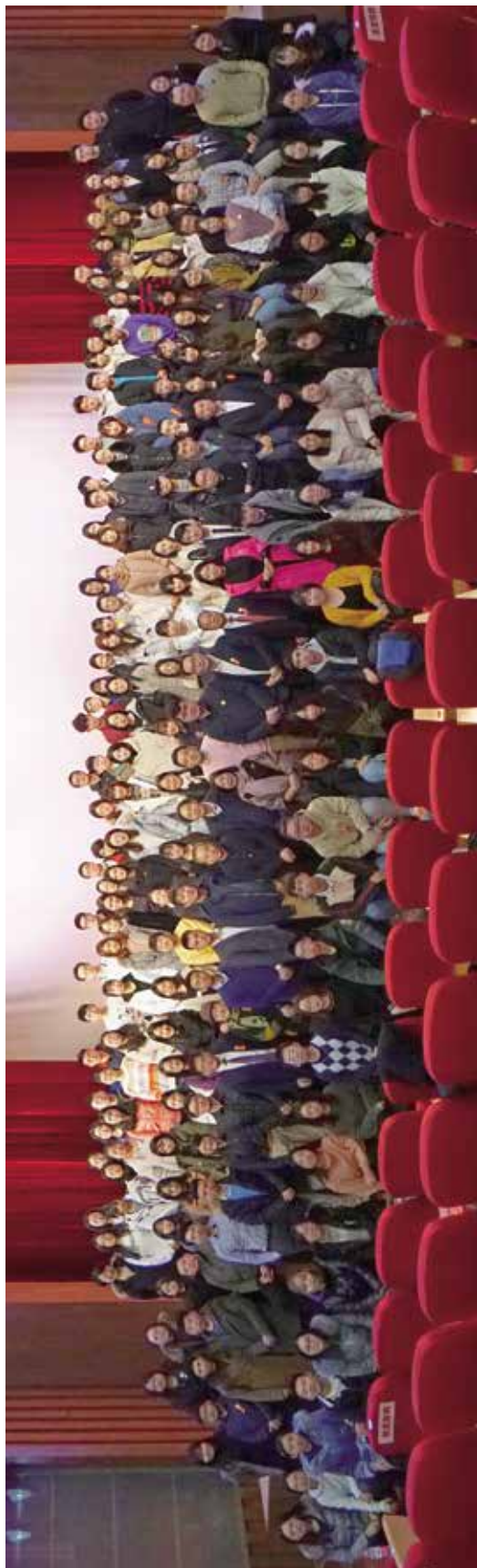
“校友导师计划”第四期结营暨第五期师徒结对仪式与会人员合影