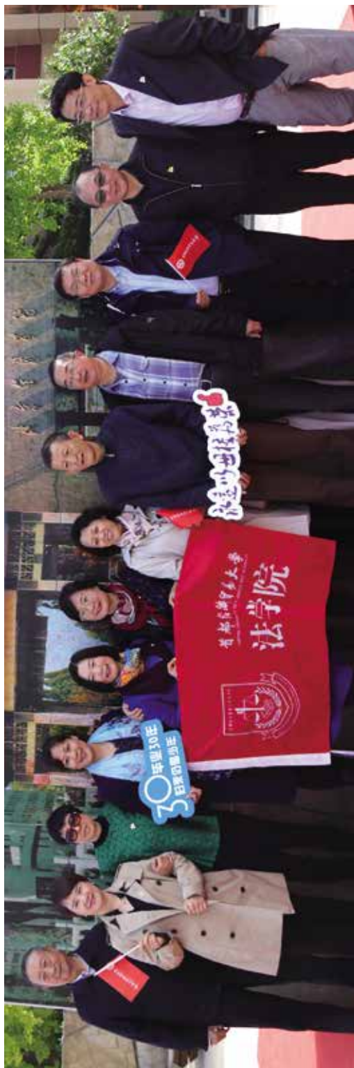
85级经济法、市场营销专业部分校友合影