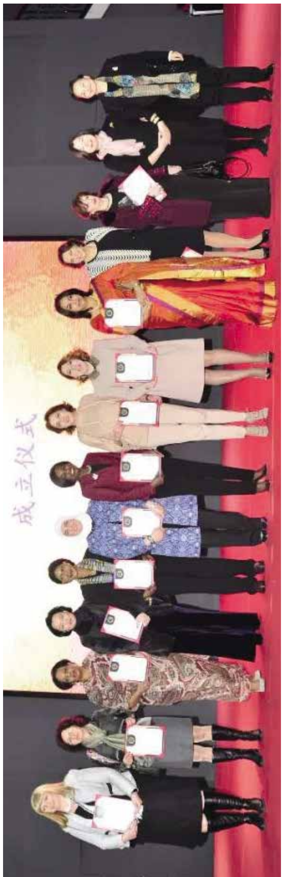
“文化艺术基金”设立仪式部分大使夫人合影