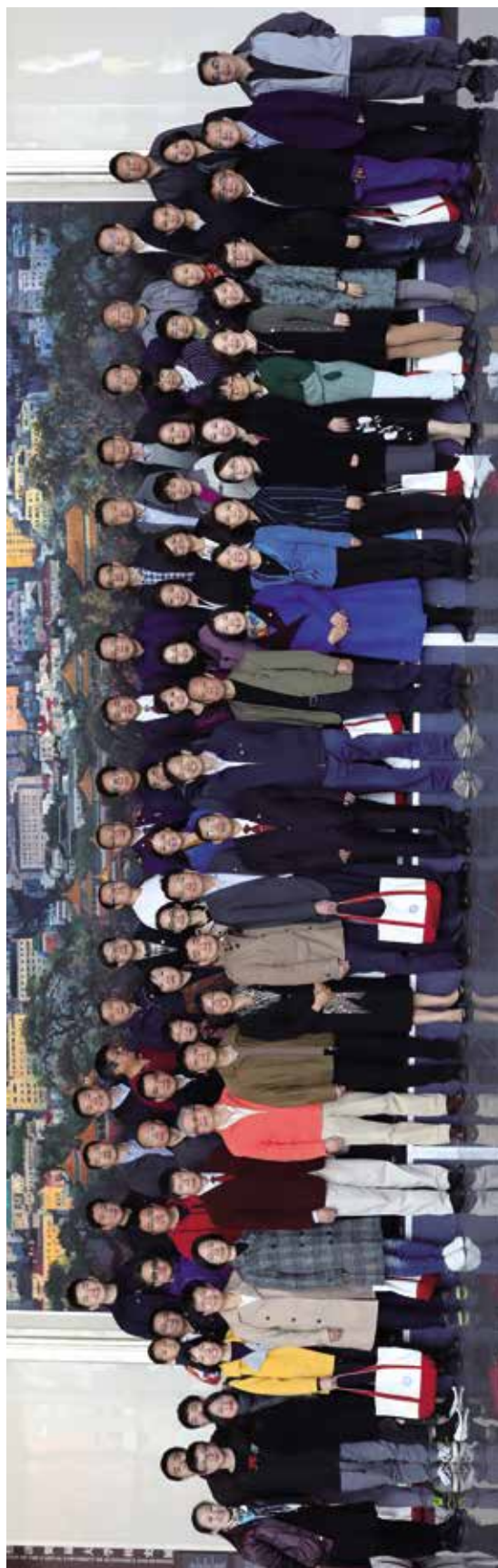
管理工程学院部分校友合影