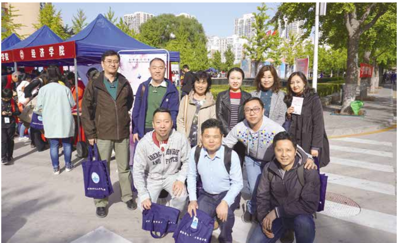
原经济系95441班部分校友合影