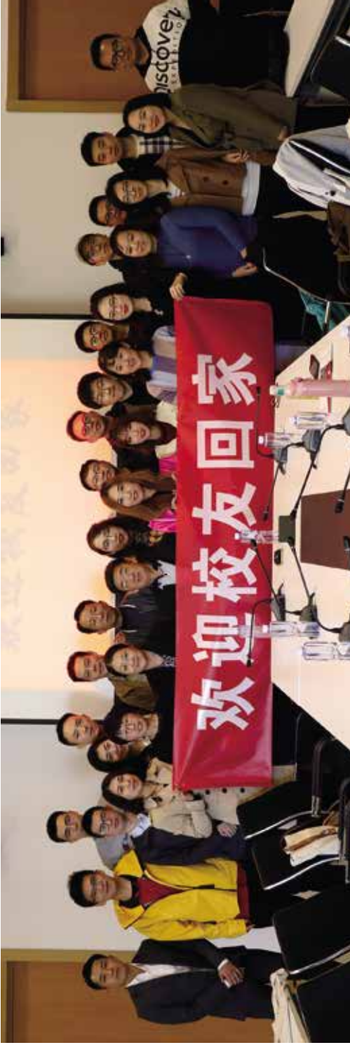
城市经济与公共管理学院部分校友合影