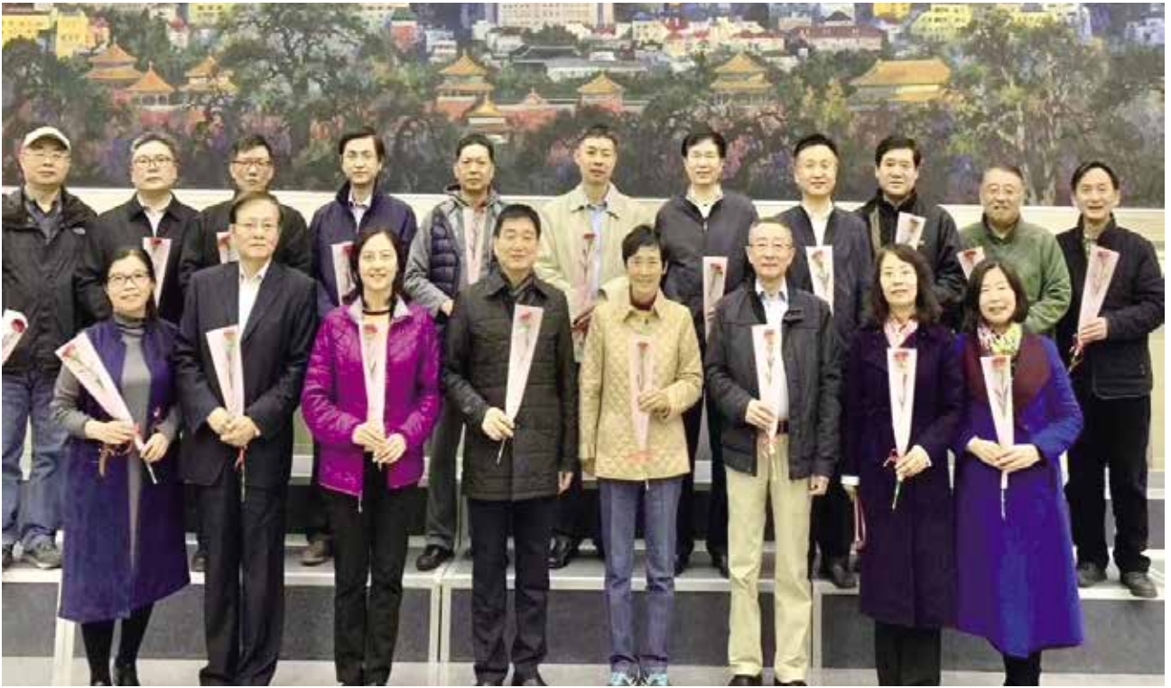
94级企业管理研究生班部分校友合影