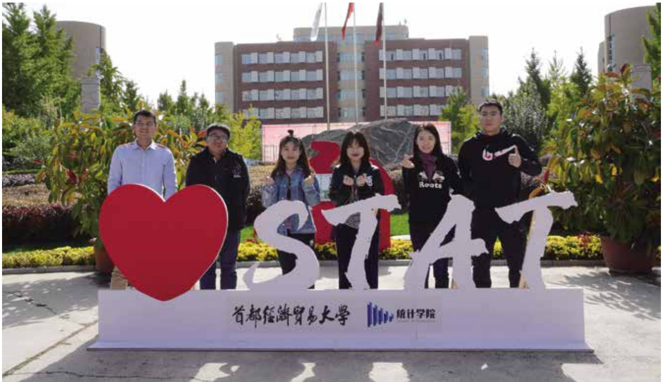
统计学院05级部分校友合影