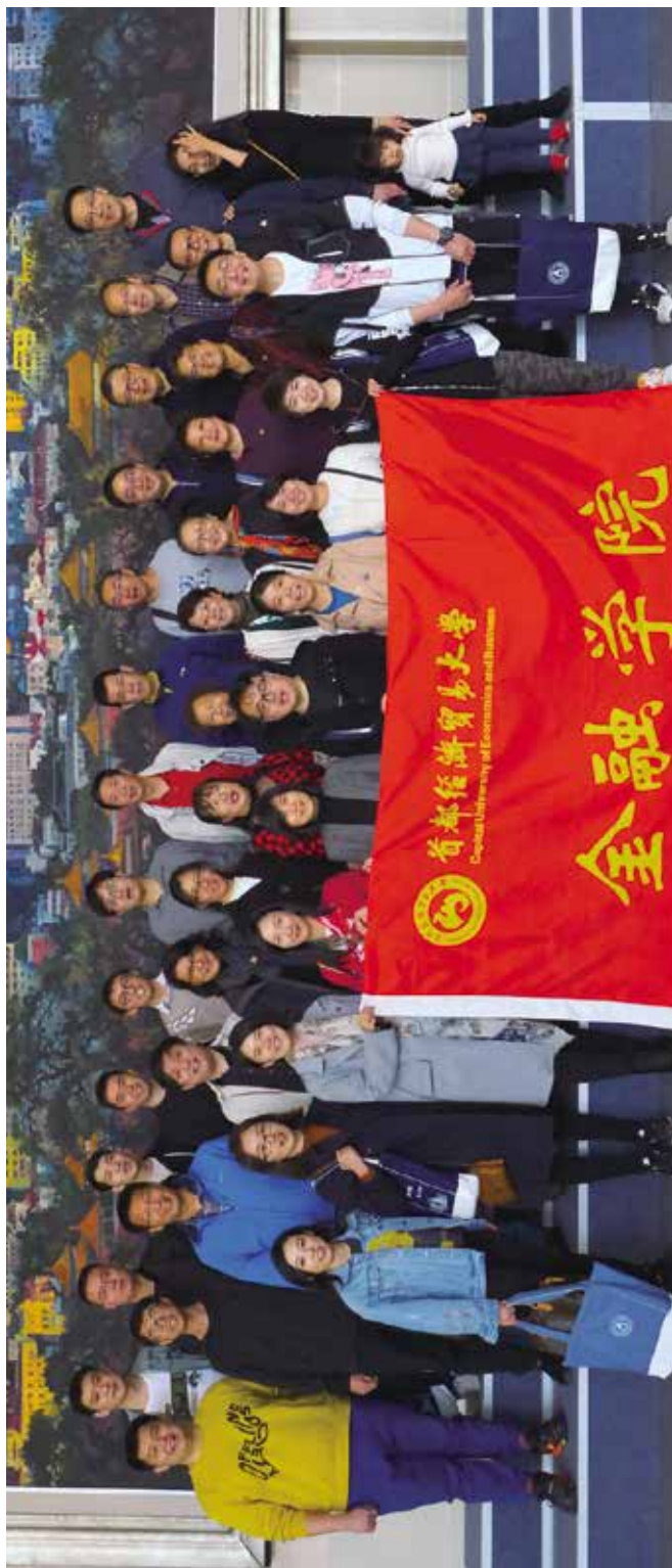
金融学院部分校友合影