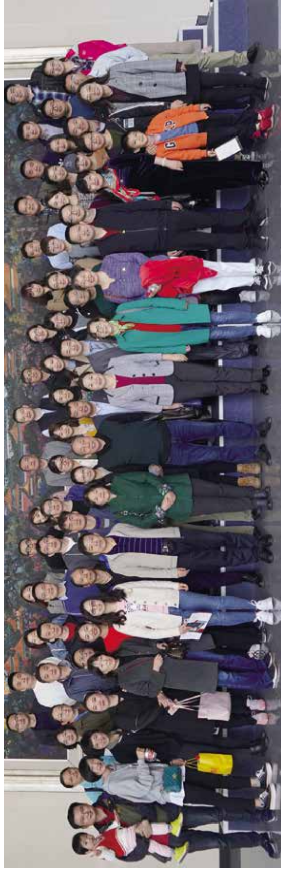
财政税务学院部分校友合影