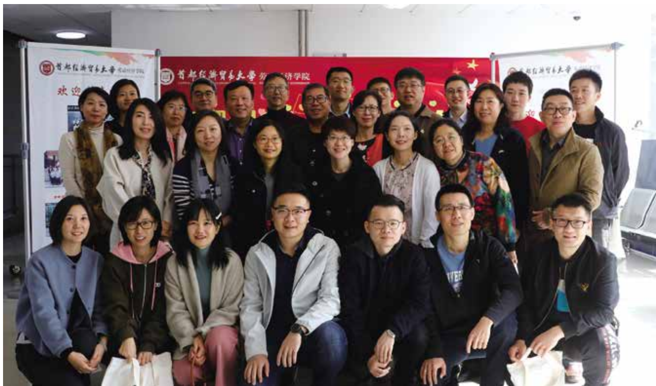
劳动经济学院部分校友合影