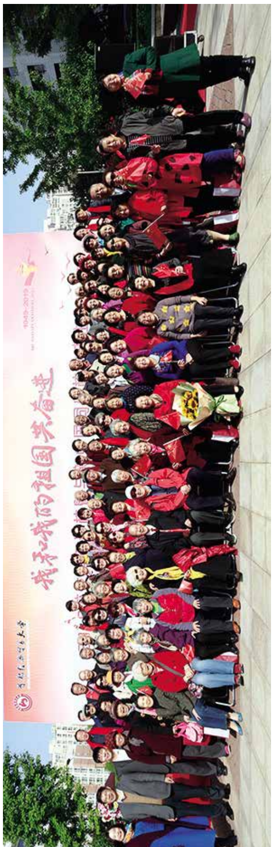
原北京财贸学校校友会部分校友合影