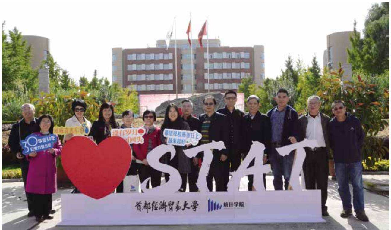
原统计系85级部分校友合影