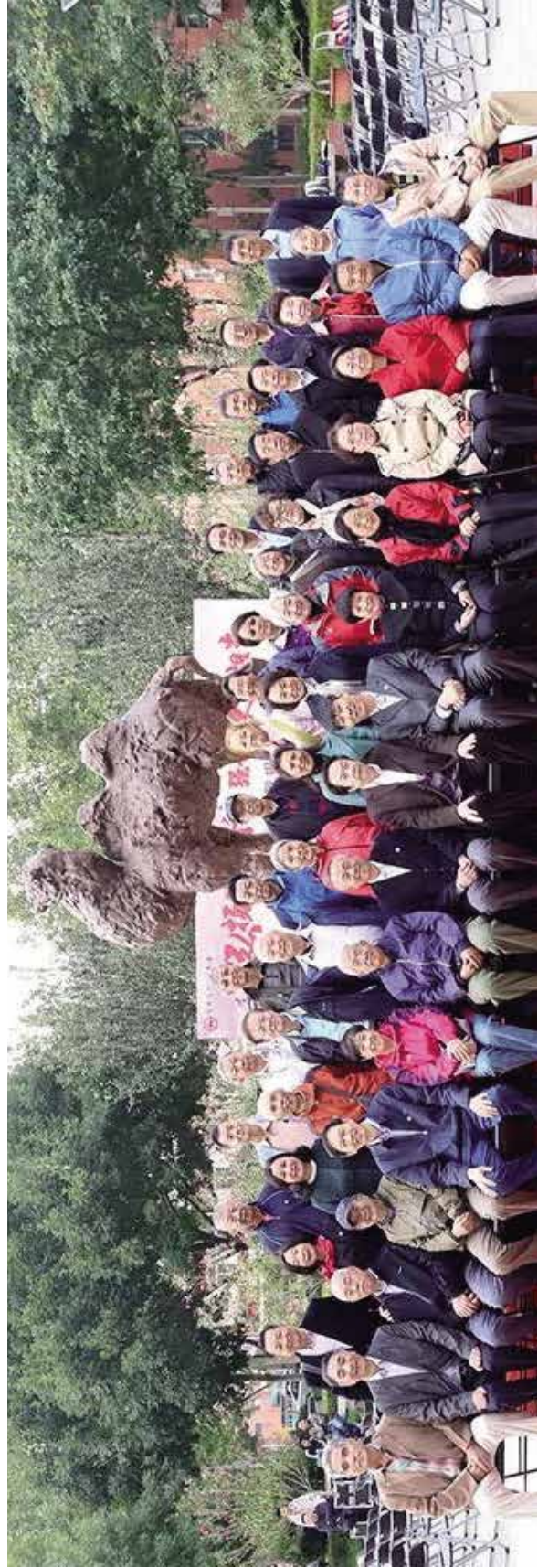
部分与会人员 在“骆驼”雕塑前合影