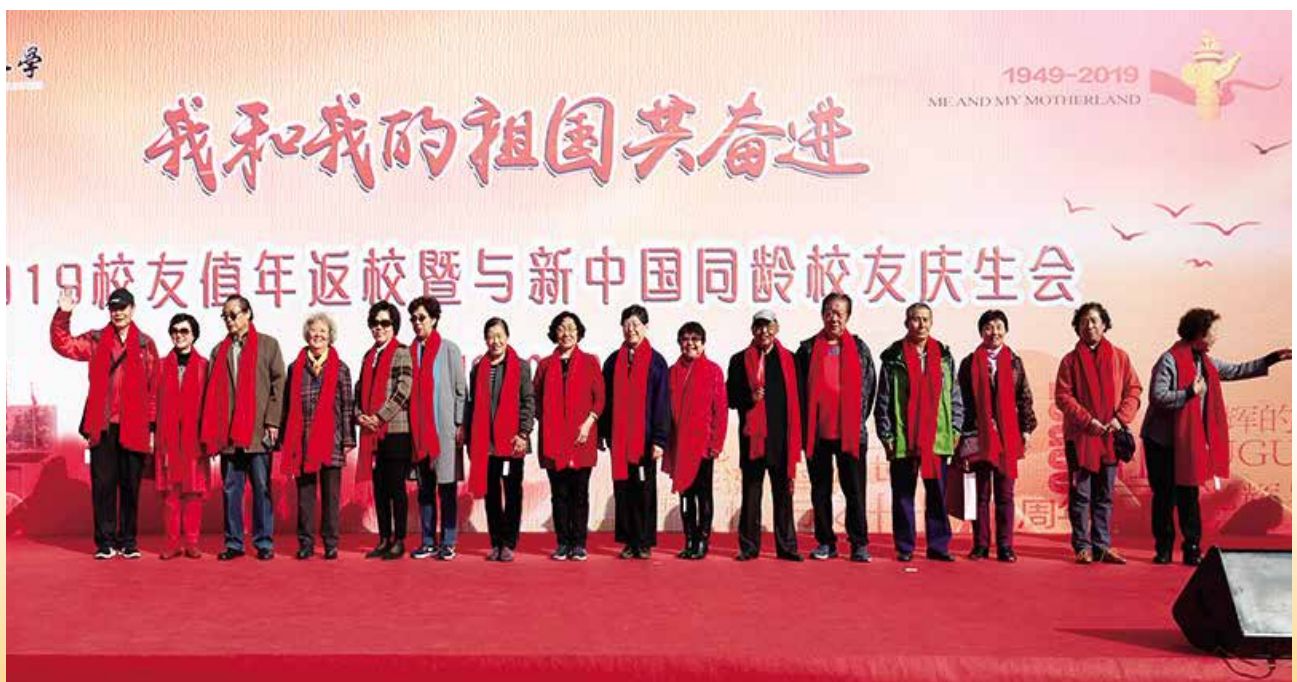
和新中国同龄部分校友合影