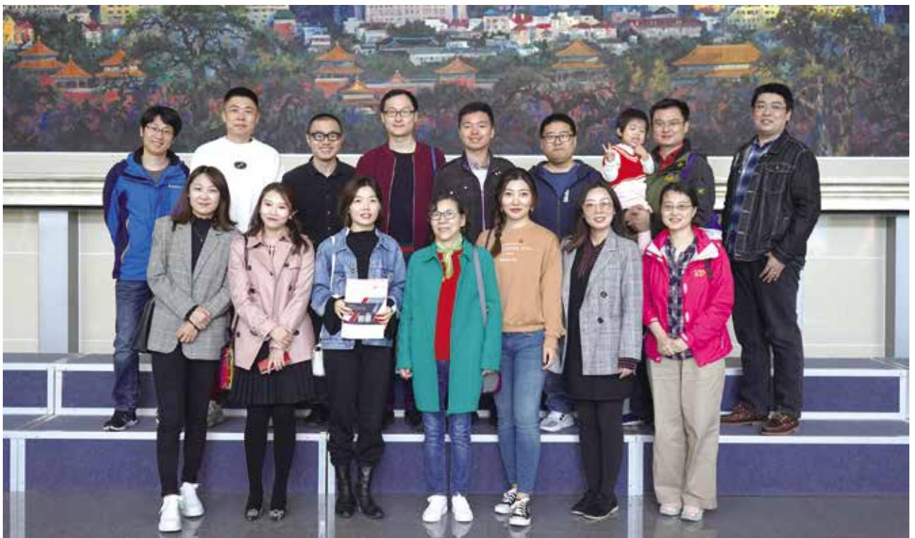
原财政系95级部分校友合影