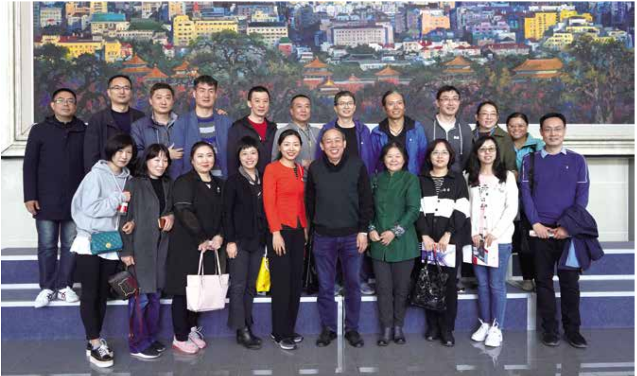
原财政系99级部分校友合影