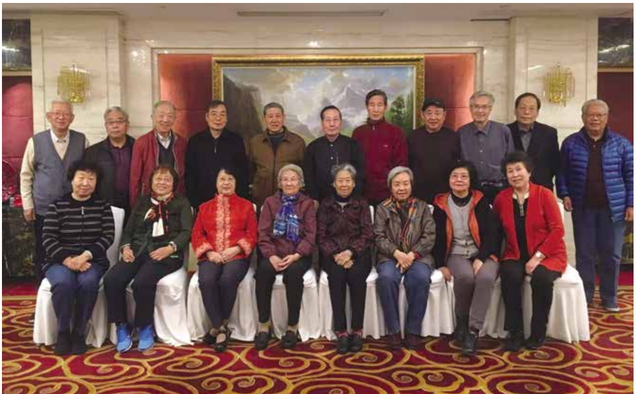
原劳动经济系1960级部分校友合影