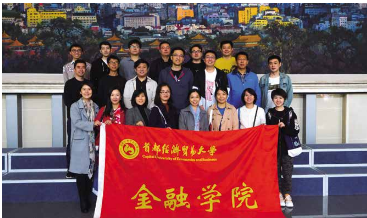
05级金融学专业部分校友合影