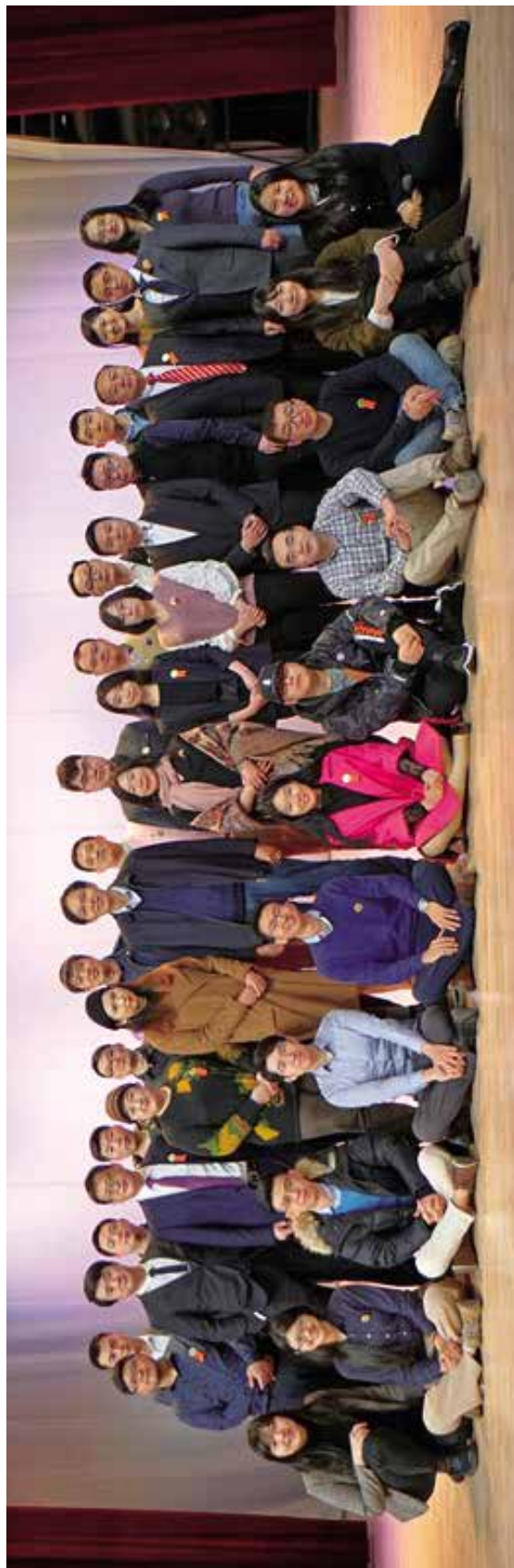
“校友导师计划”部分导师合影