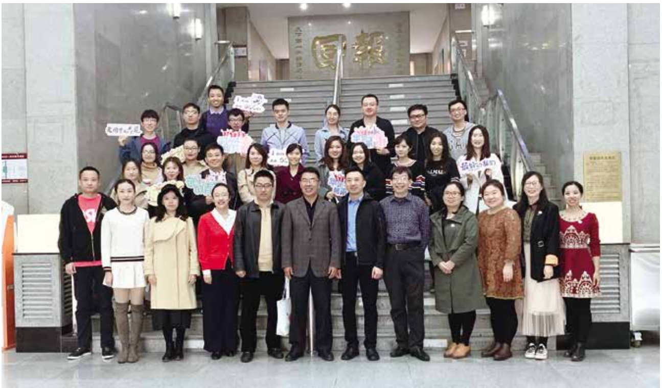
华侨学院部分校友合影