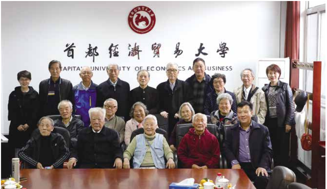
原劳动经济系1959级部分校友合影