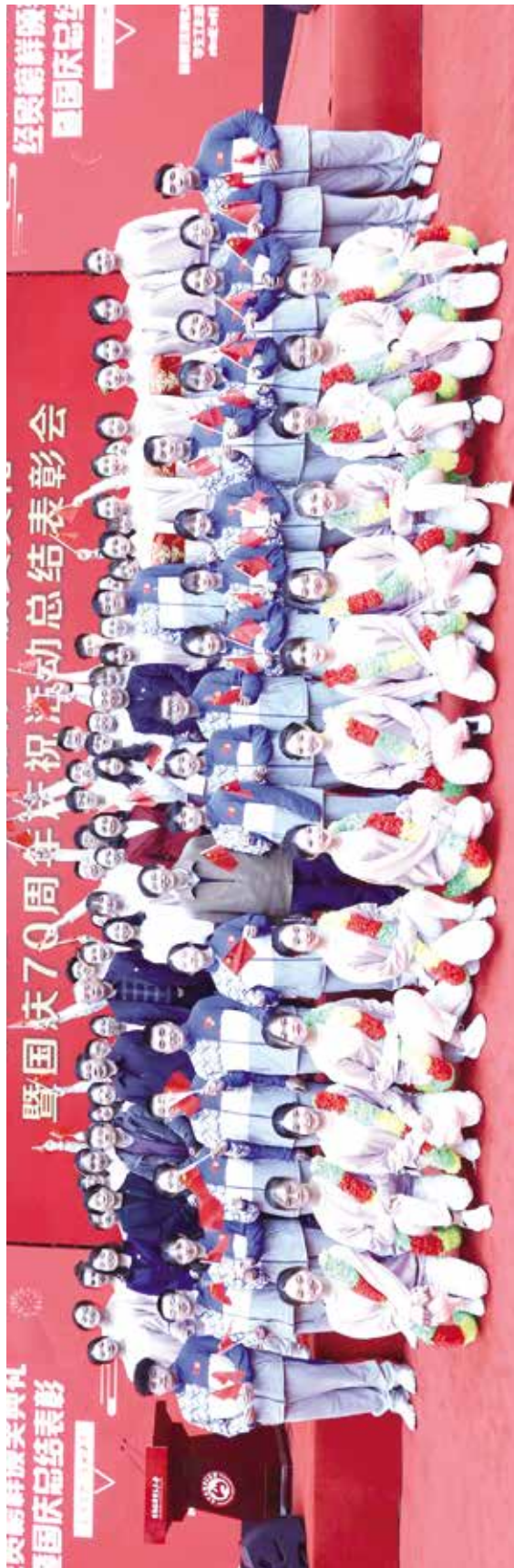
“经贸榜样”颁奖典礼暨新中国成立70周年庆祝活动总结表彰会部分人员合影