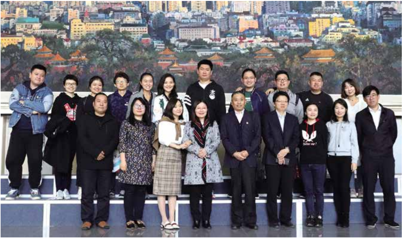
文化与传播学院05级部分校友合影