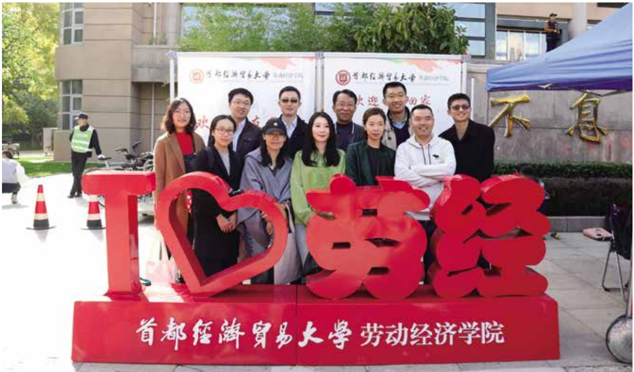
05级人力资源管理实验班部分校友合影