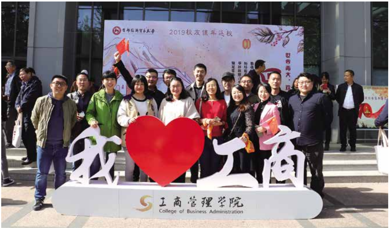
05级电子商务班部分校友合影