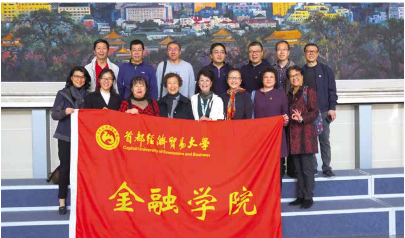
85级金融学专业部分校友合影