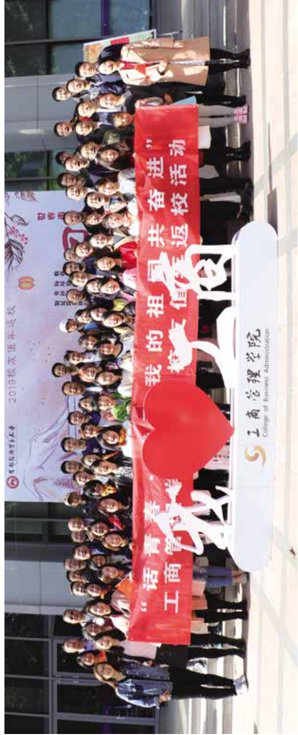
工商管理学院部分校友合影