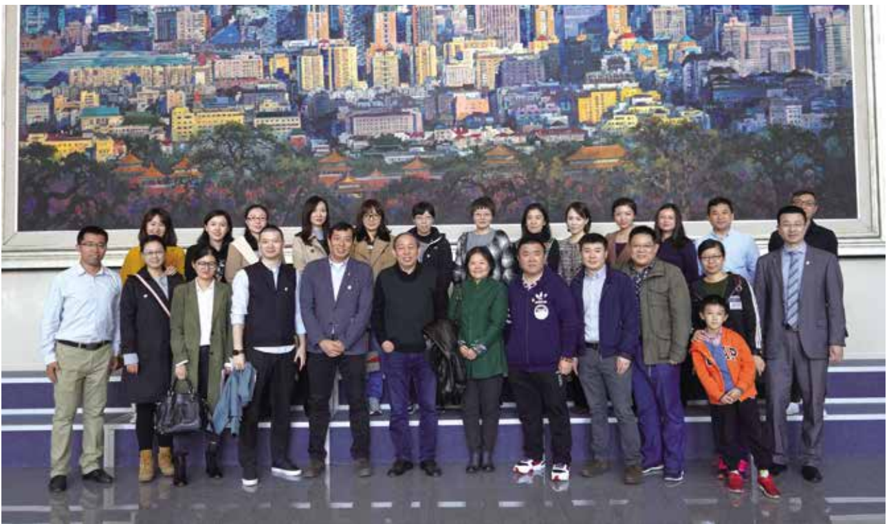
财政税务学院05级部分校友合影