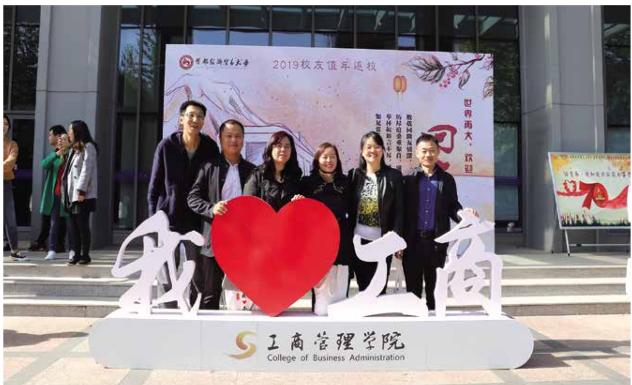
07级MBA班部分校友合影