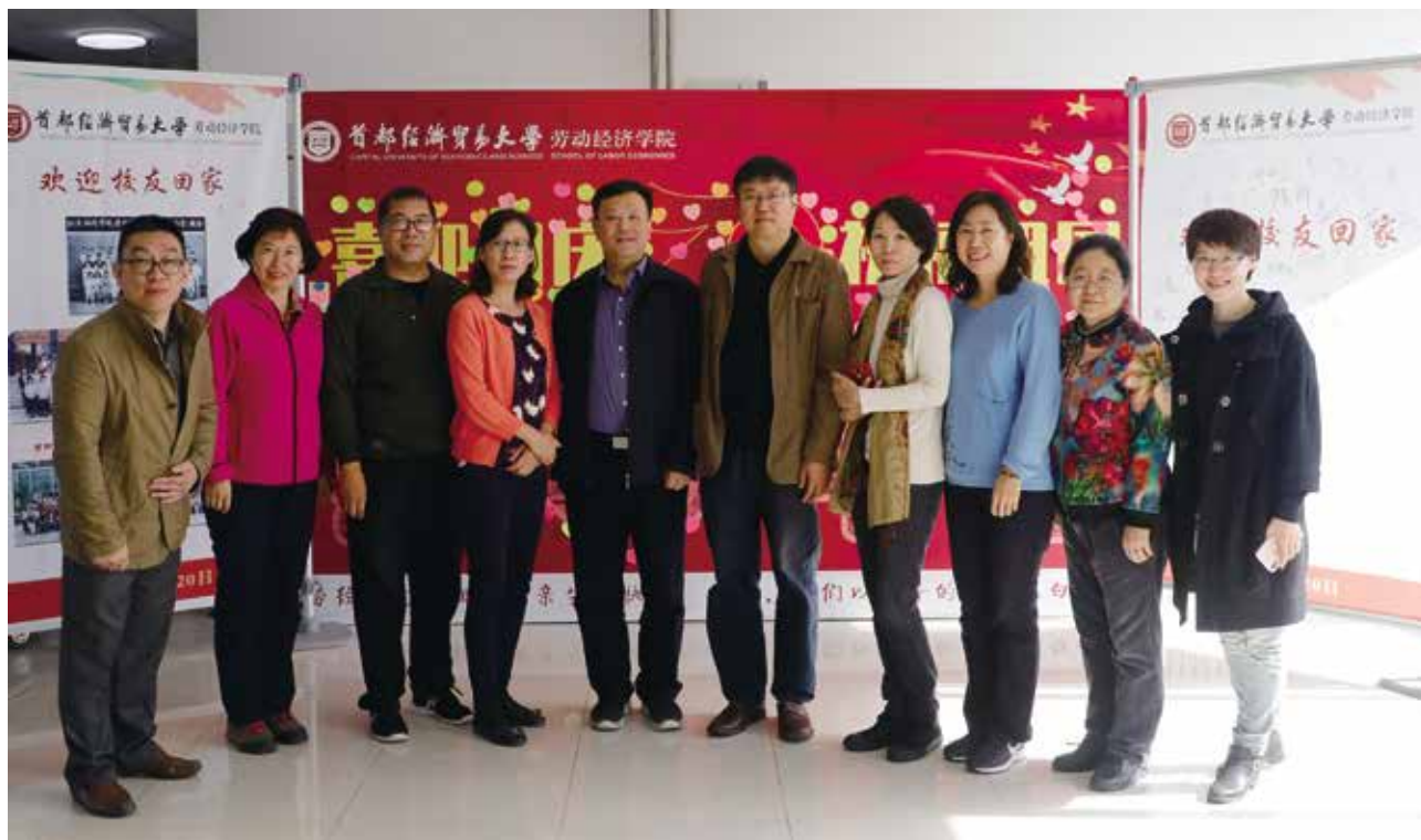
原劳动经济系9521班部分校友合影