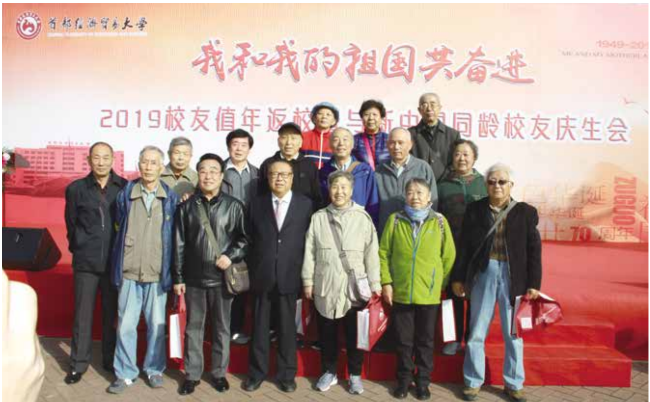
工商管理（60年代）校友会部分校友合影