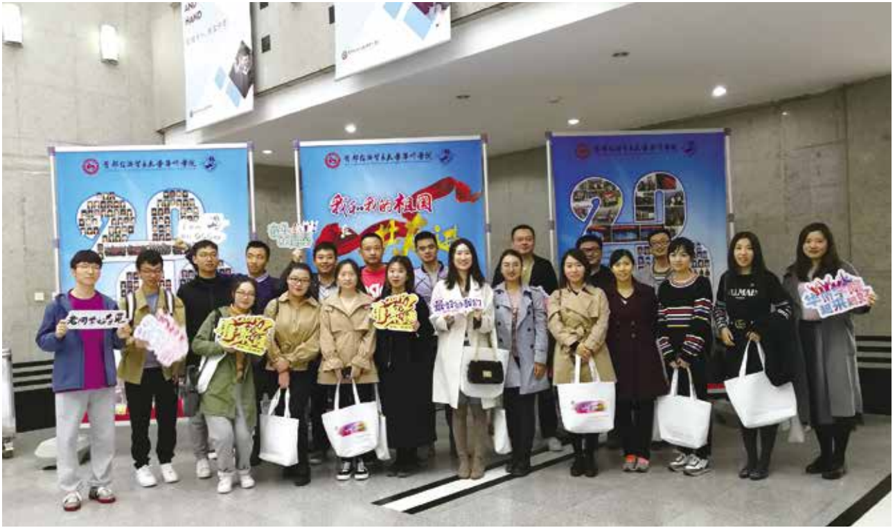
华侨学院05级部分校友合影