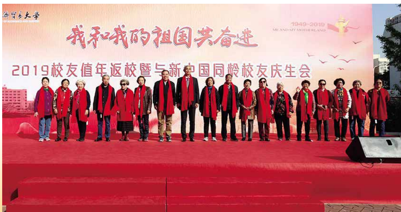
和新中国同龄部分校友合影