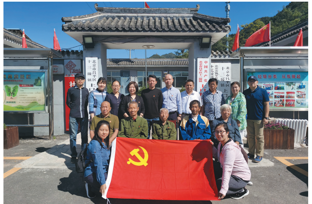
外联处慰问昌平区上口村老党员合影