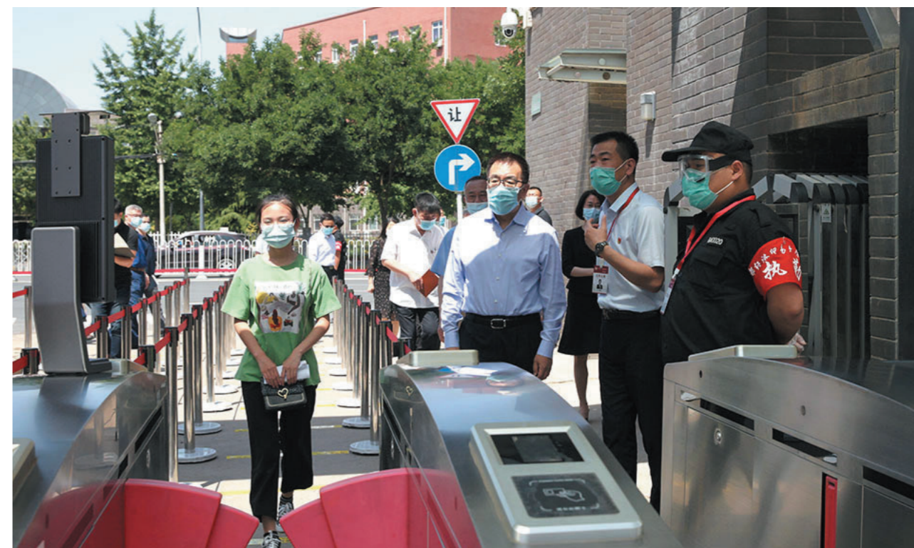
市领导王宁（中）来我校检查督导疫情防控工作