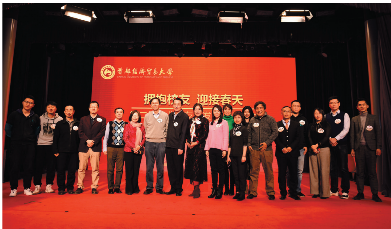
金融科技校友会（筹）部分校友合影