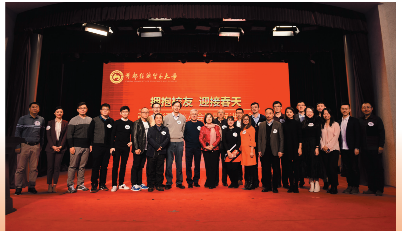
资管行业校友会（筹）部分校友合影