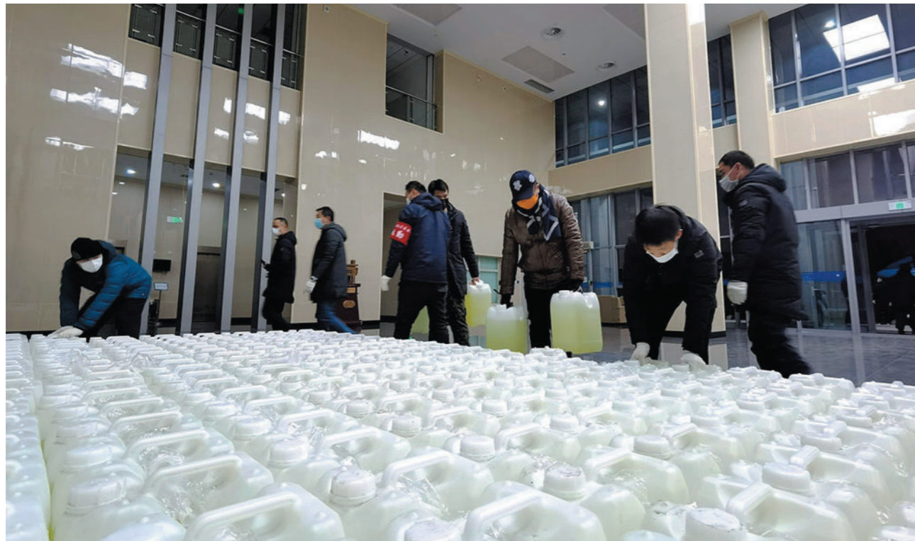
中海油天津化工研究设计院向我校捐赠消毒液