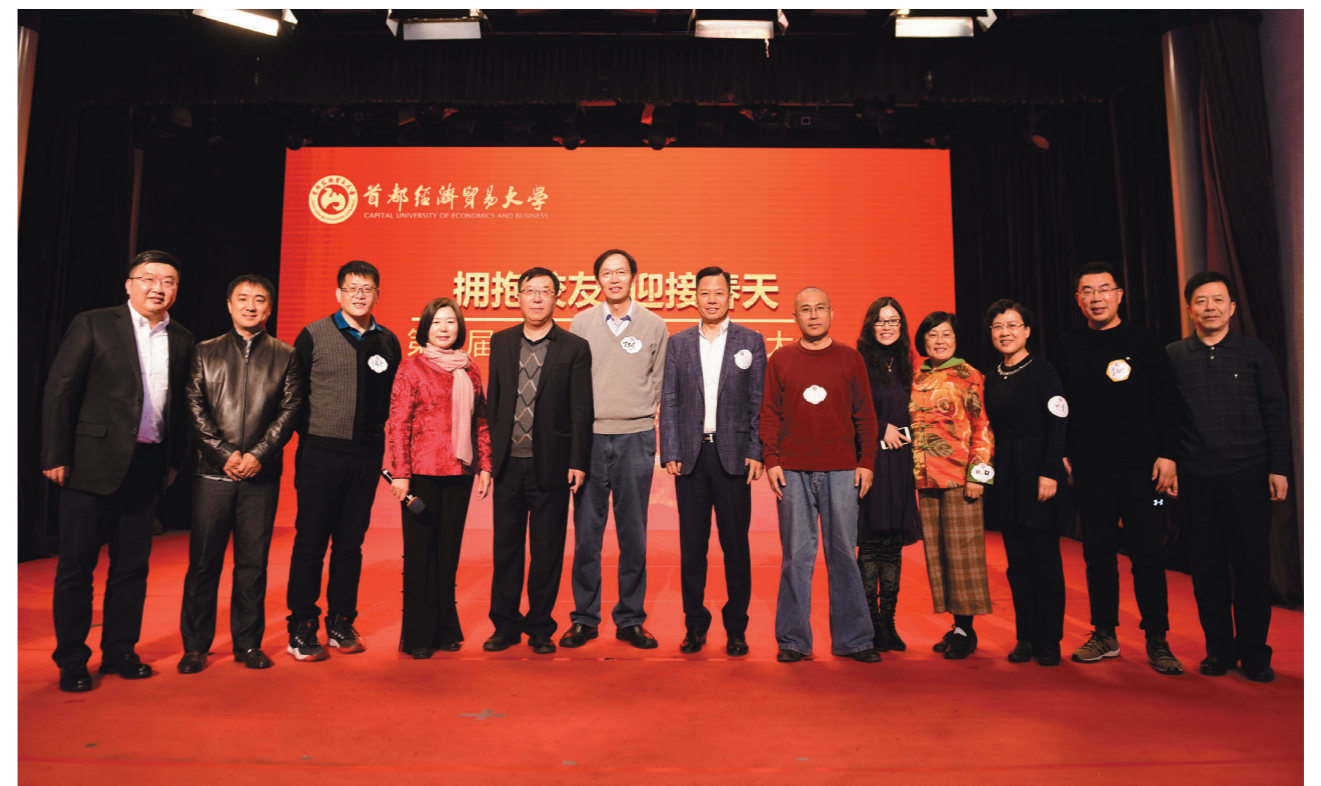
会计行业部分校友合影