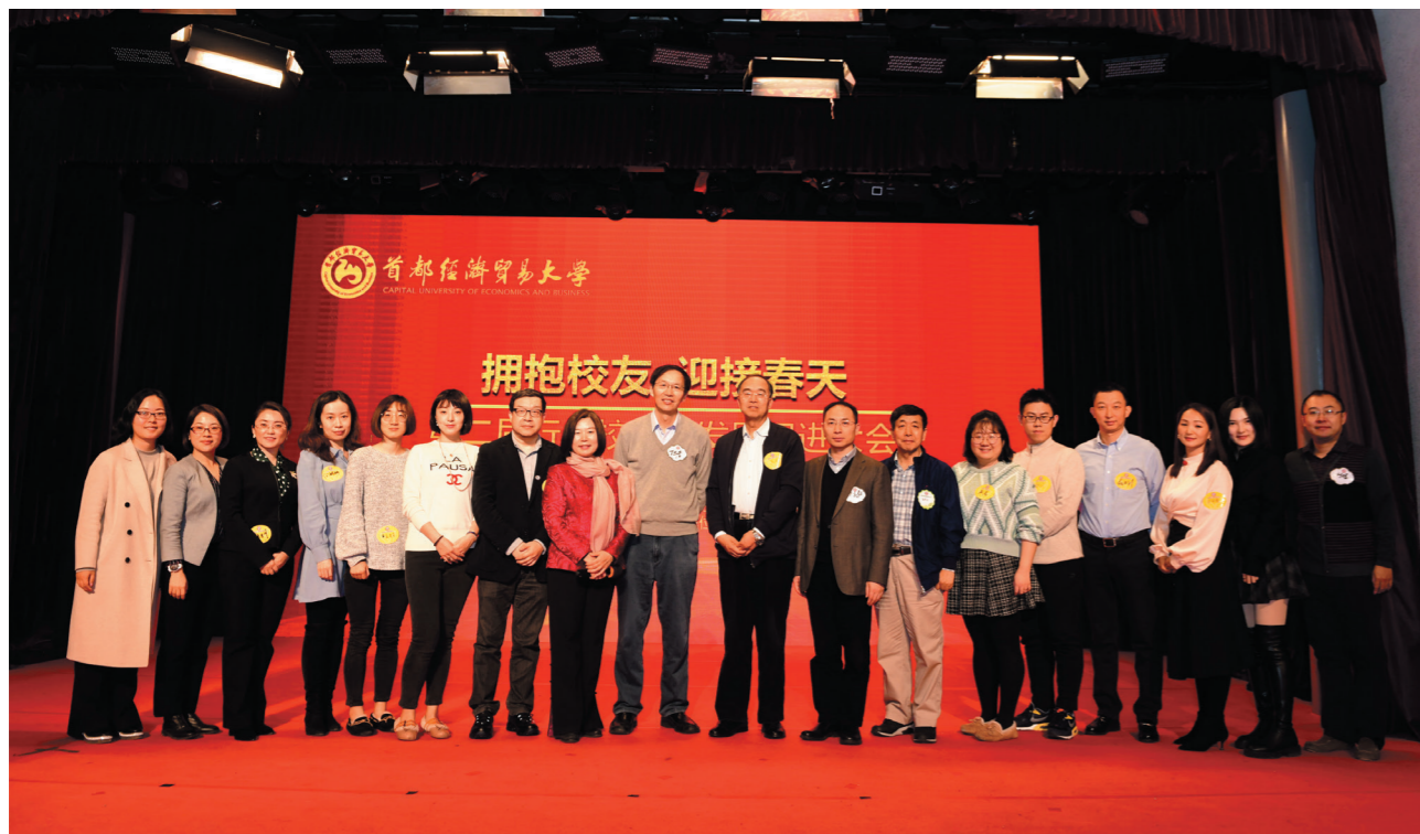
保险行业校友会部分校友合影