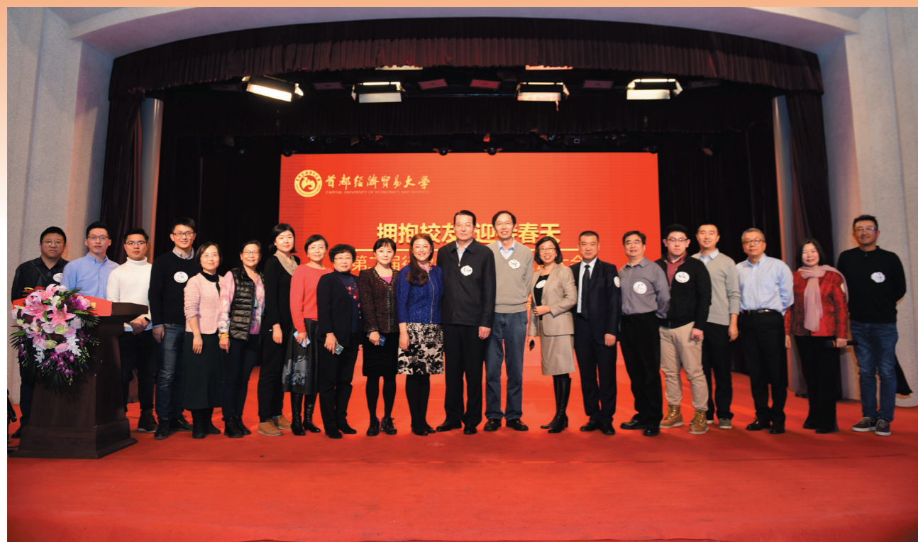
安全卫生环境校友会部分校友合影