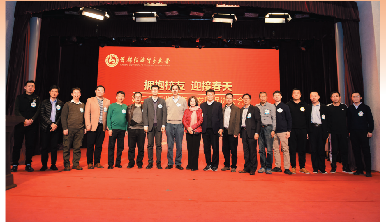
MBA校友会部分校友合影