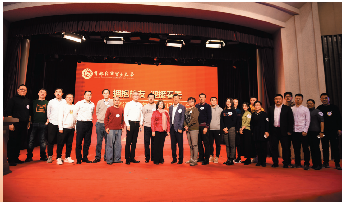
财税行业校友会部分校友合影