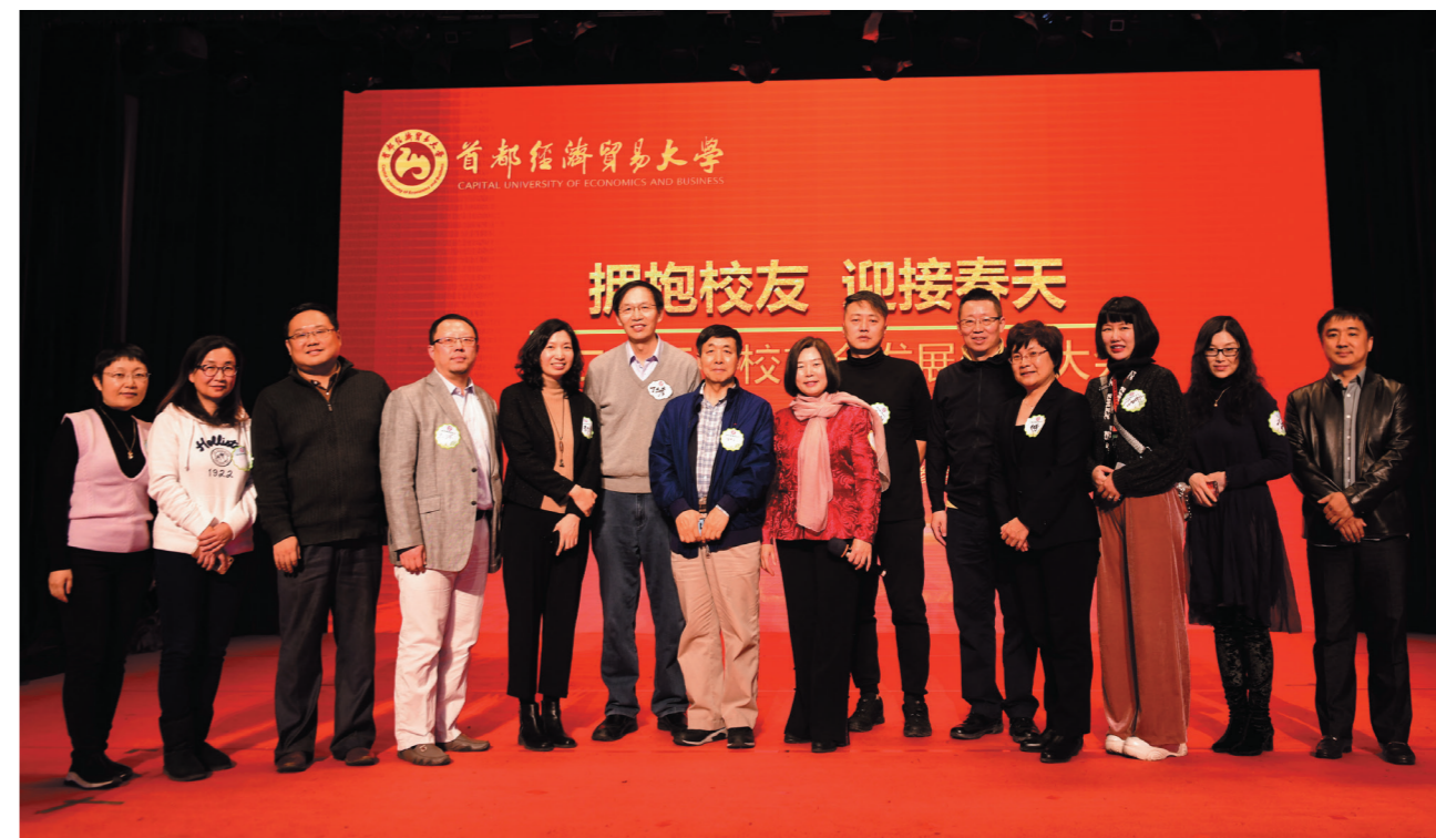
医疗健康校友会部分校友合影