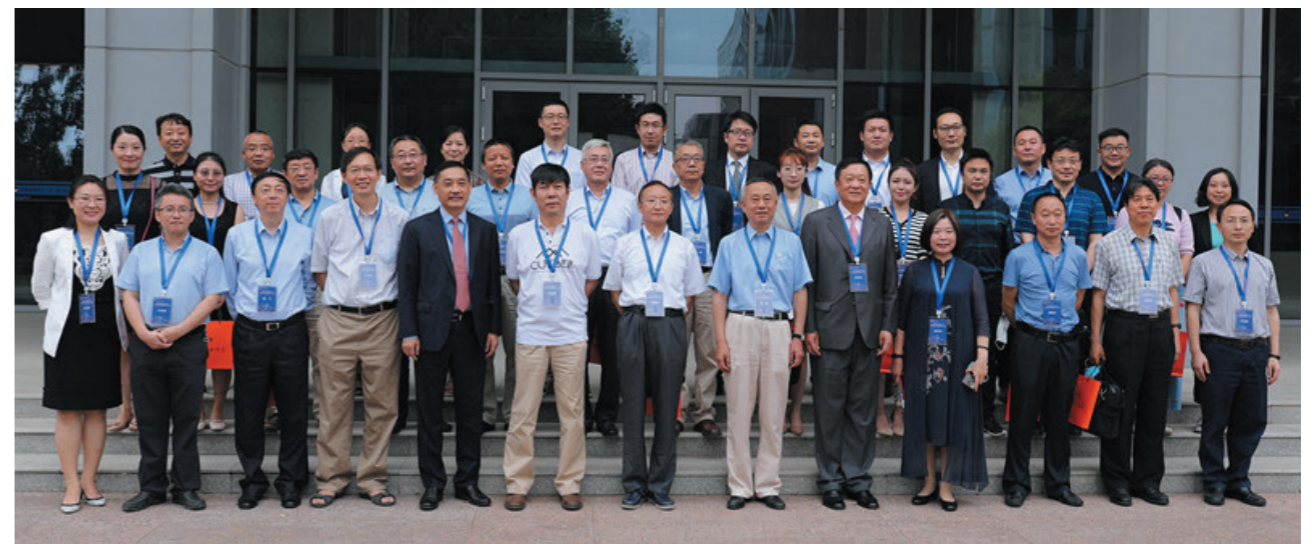
首经贸中国ESG研究院成立大会与会人员合影