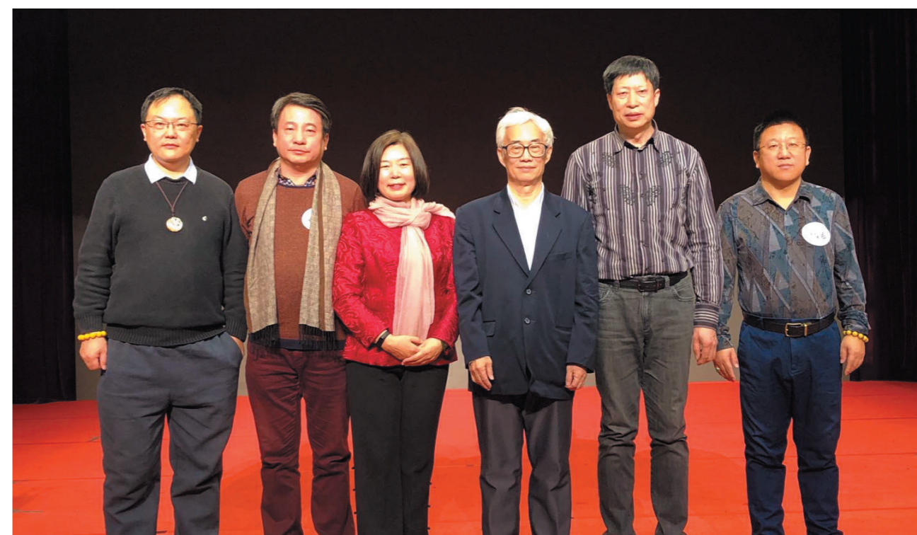
文化艺术校友会（筹）部分校友合影