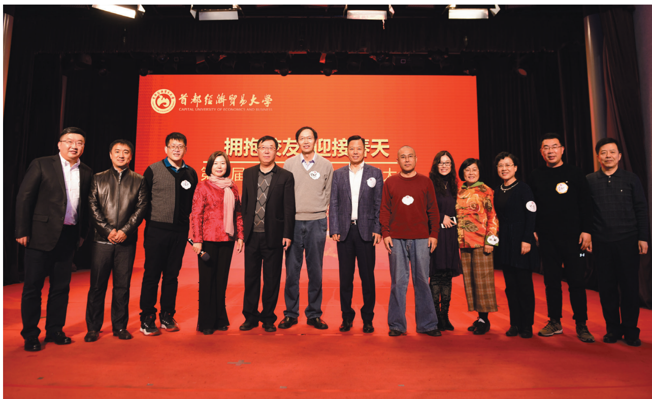
会计行业部分校友合影