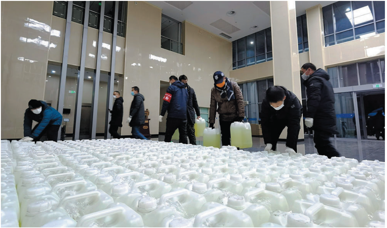
中海油天津化工研究设计院向我校捐赠消毒液