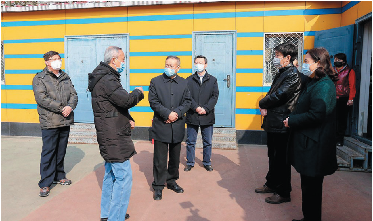
市领导张家明（左三）检查我校疫情防控工作