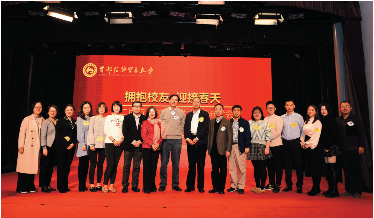
保险行业校友会部分校友合影