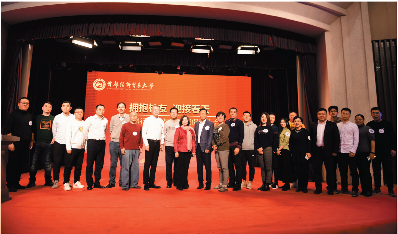
财税行业校友会部分校友合影