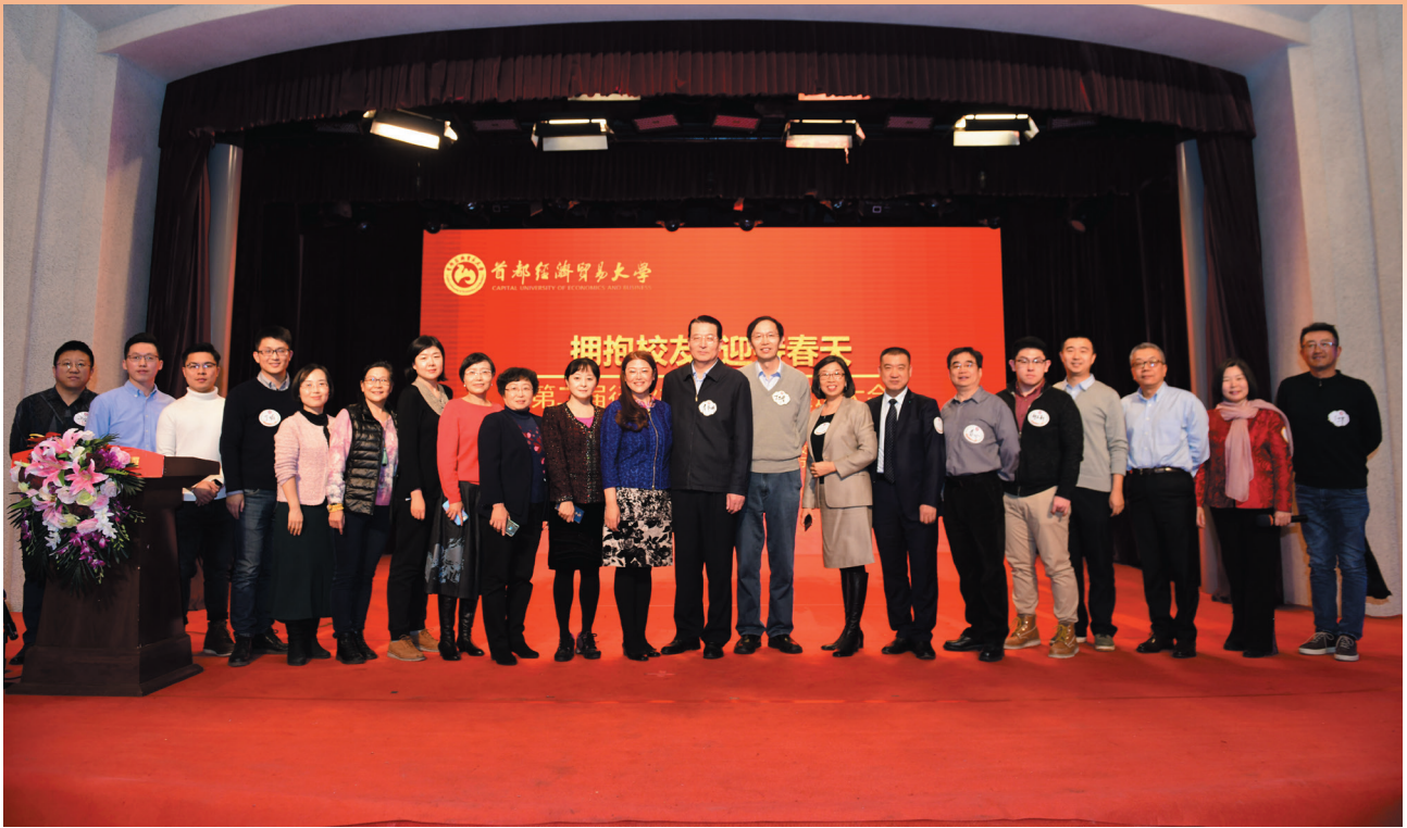
安全卫生环境校友会部分校友合影