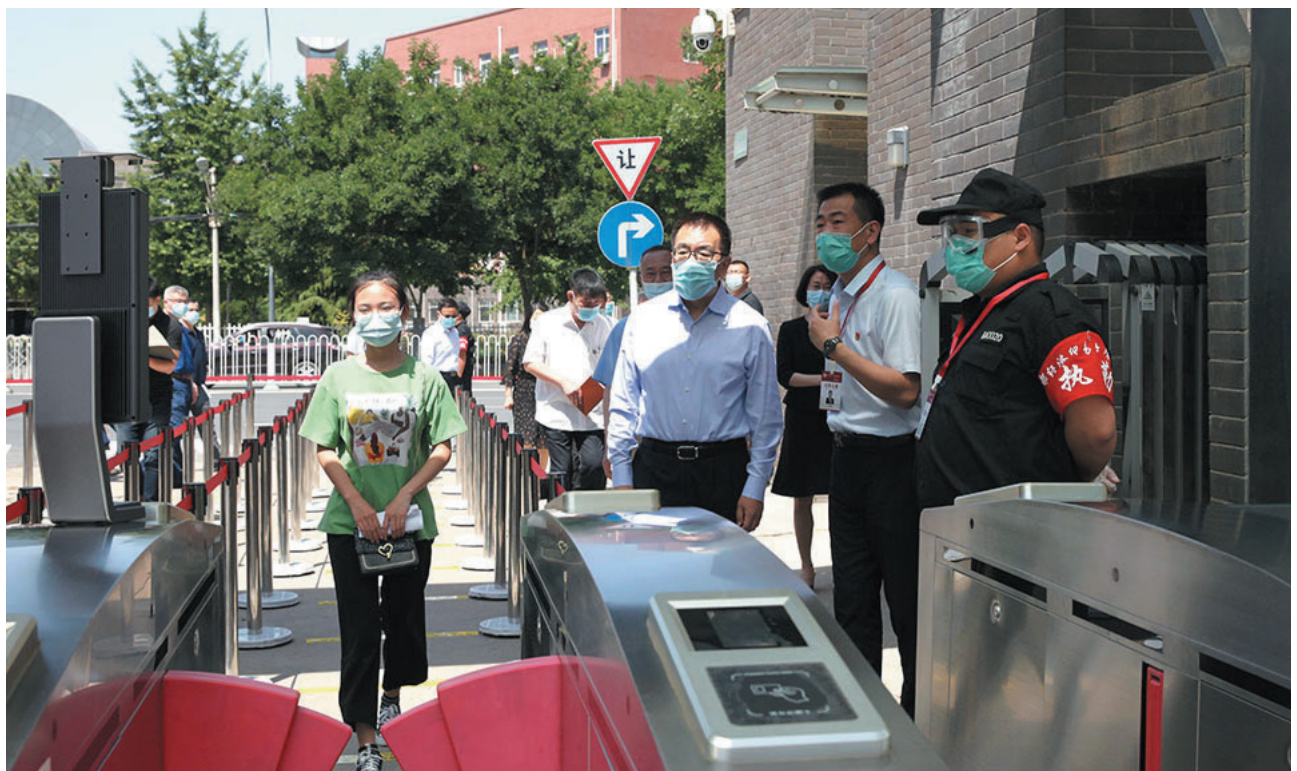
市领导王宁（中）来我校检查督导疫情防控工作