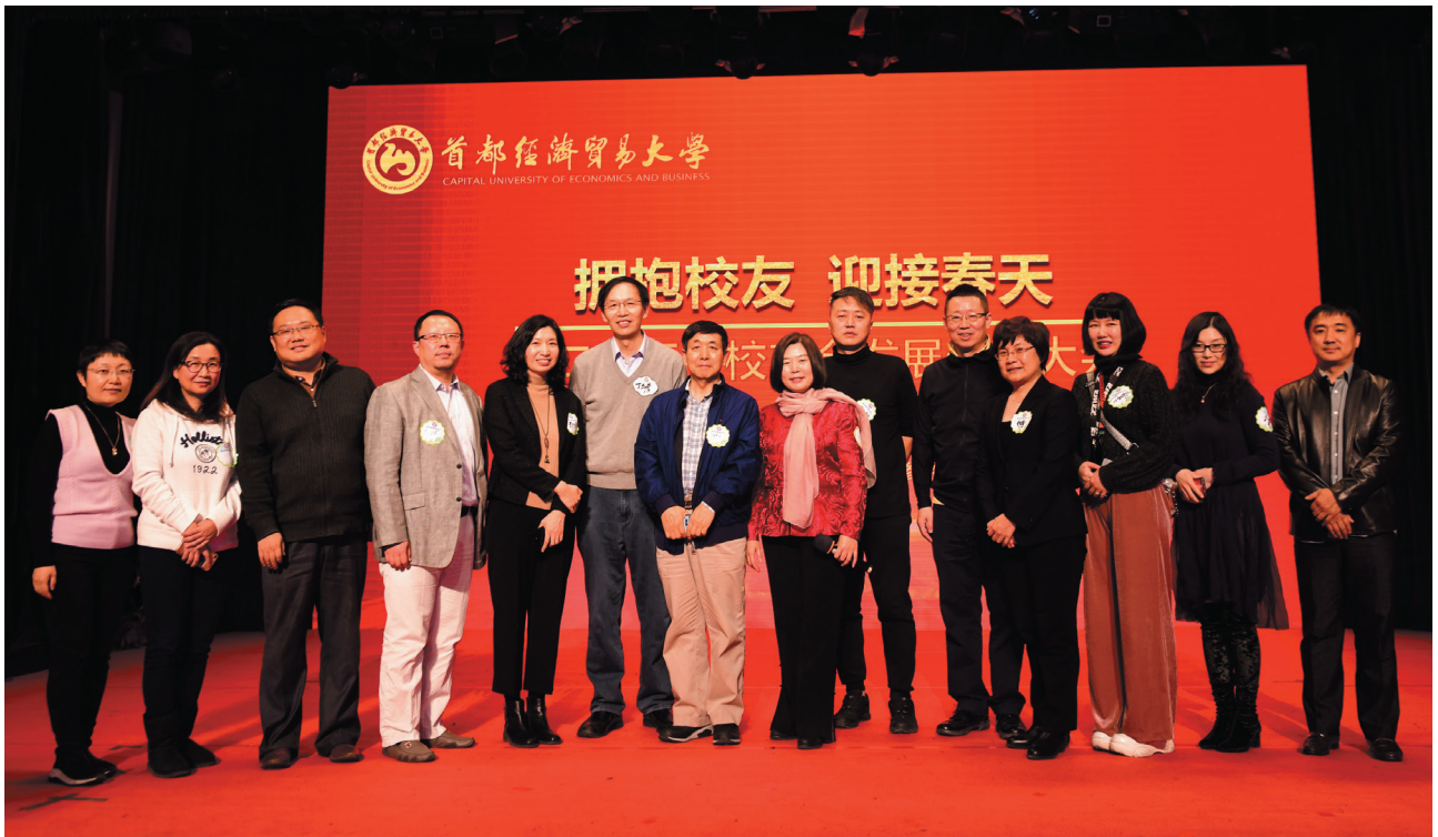
医疗健康校友会部分校友合影