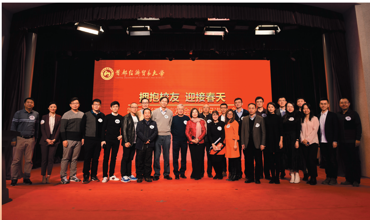
资管行业校友会（筹）部分校友合影