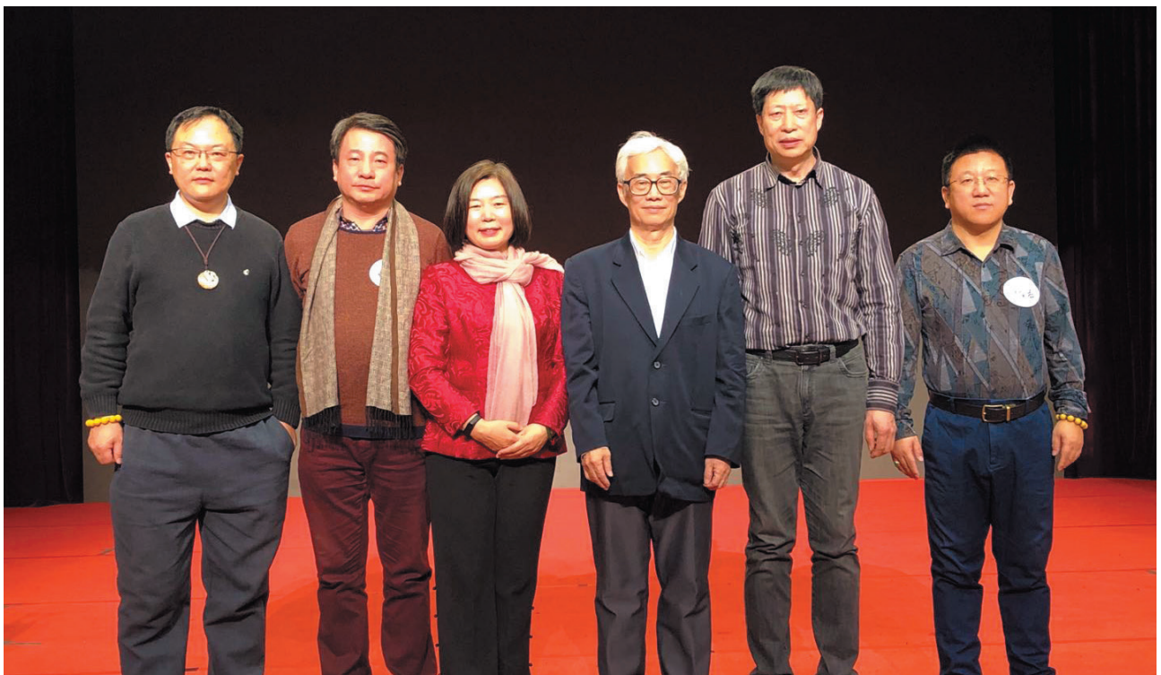
文化艺术校友会（筹）部分校友合影