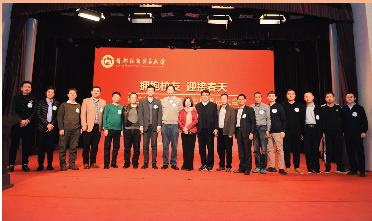
MBA校友会部分校友合影