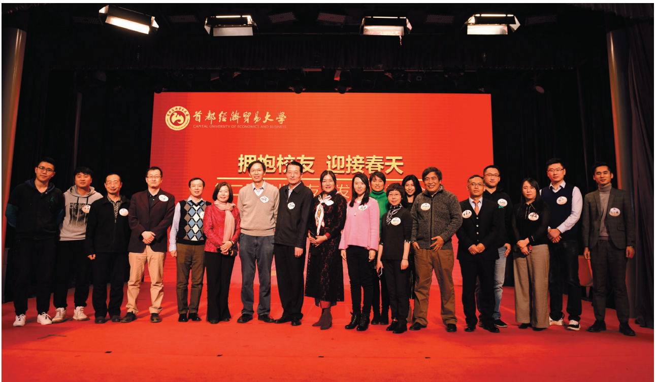
金融科技校友会（筹）部分校友合影