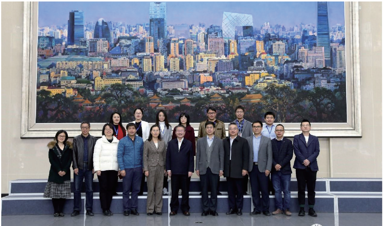
2020年本科人才培养暨一流专业建设研讨会与会人员合影