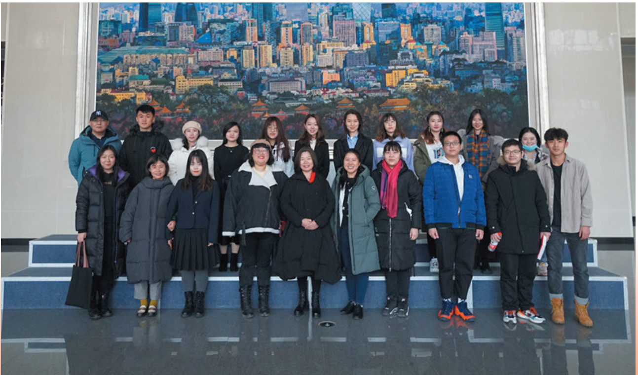
2020届毕业生部分校友联络员合影