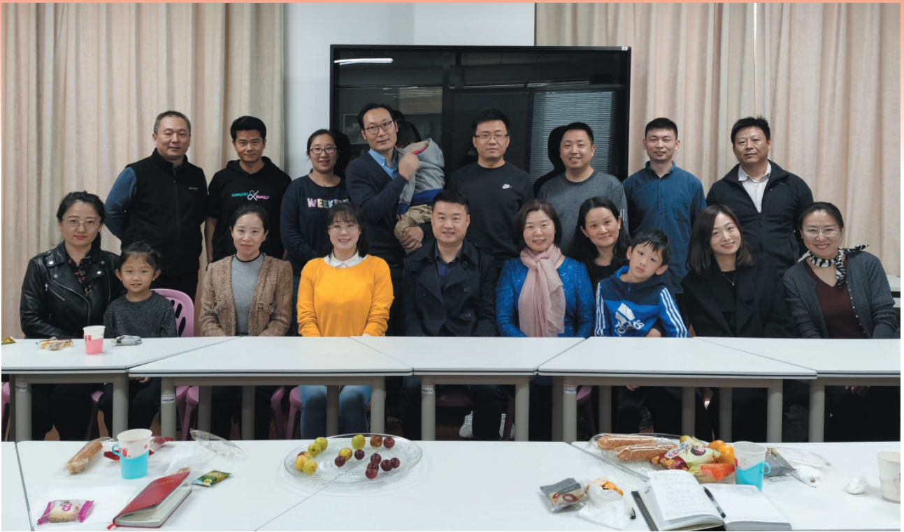
科技育儿知识讲座与会人员合影