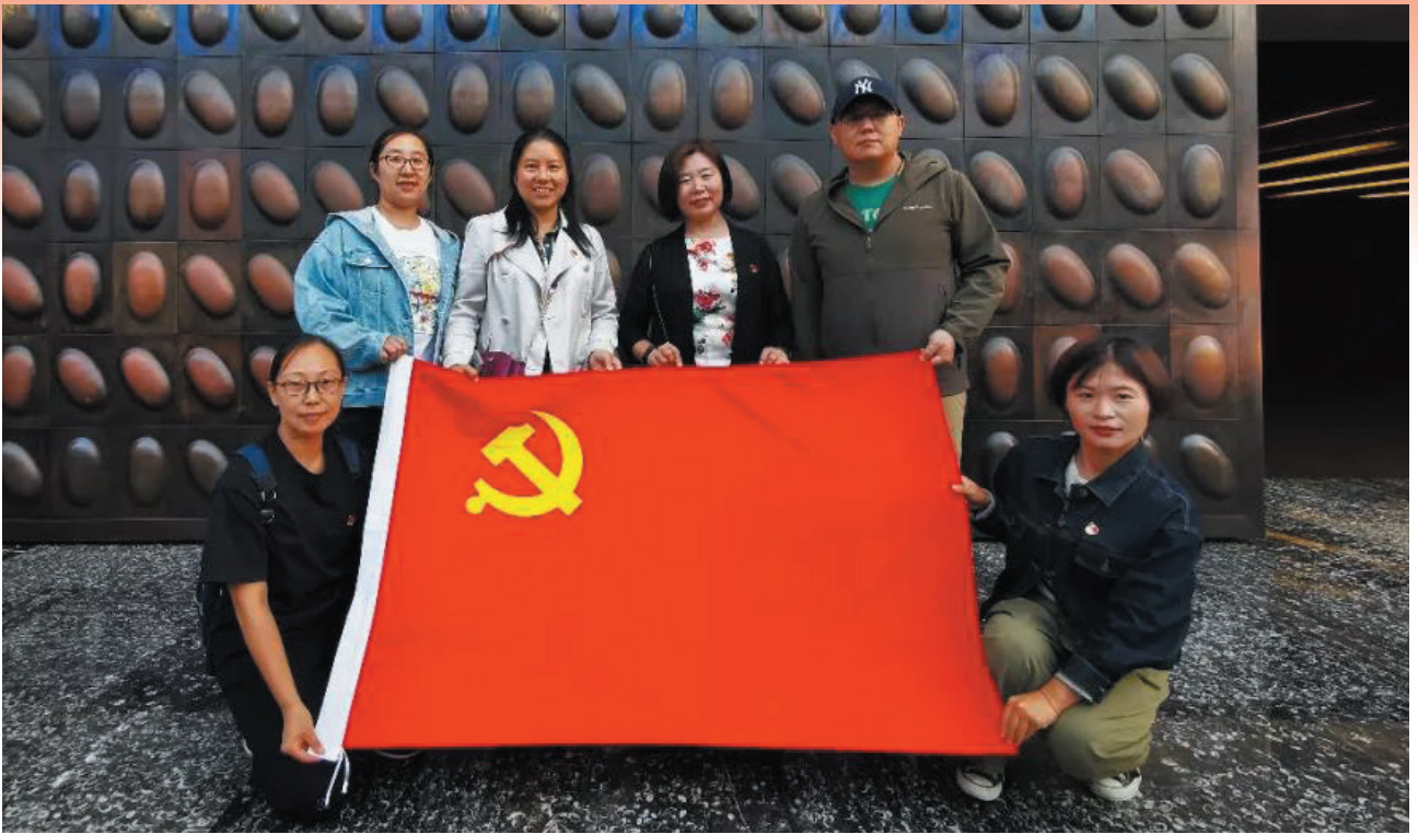
外联处党支部参观国家大剧院