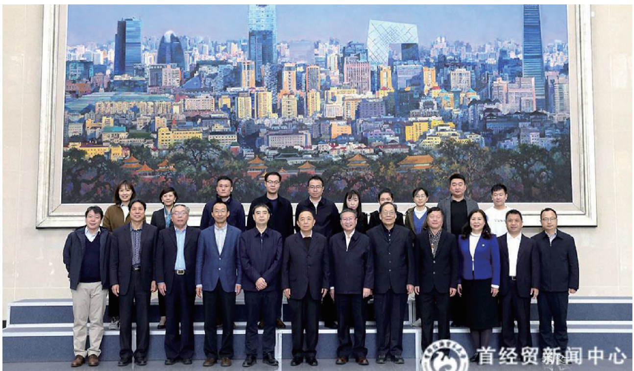
中国劳动学会劳动科学教育分会2020年年会与会人员合影