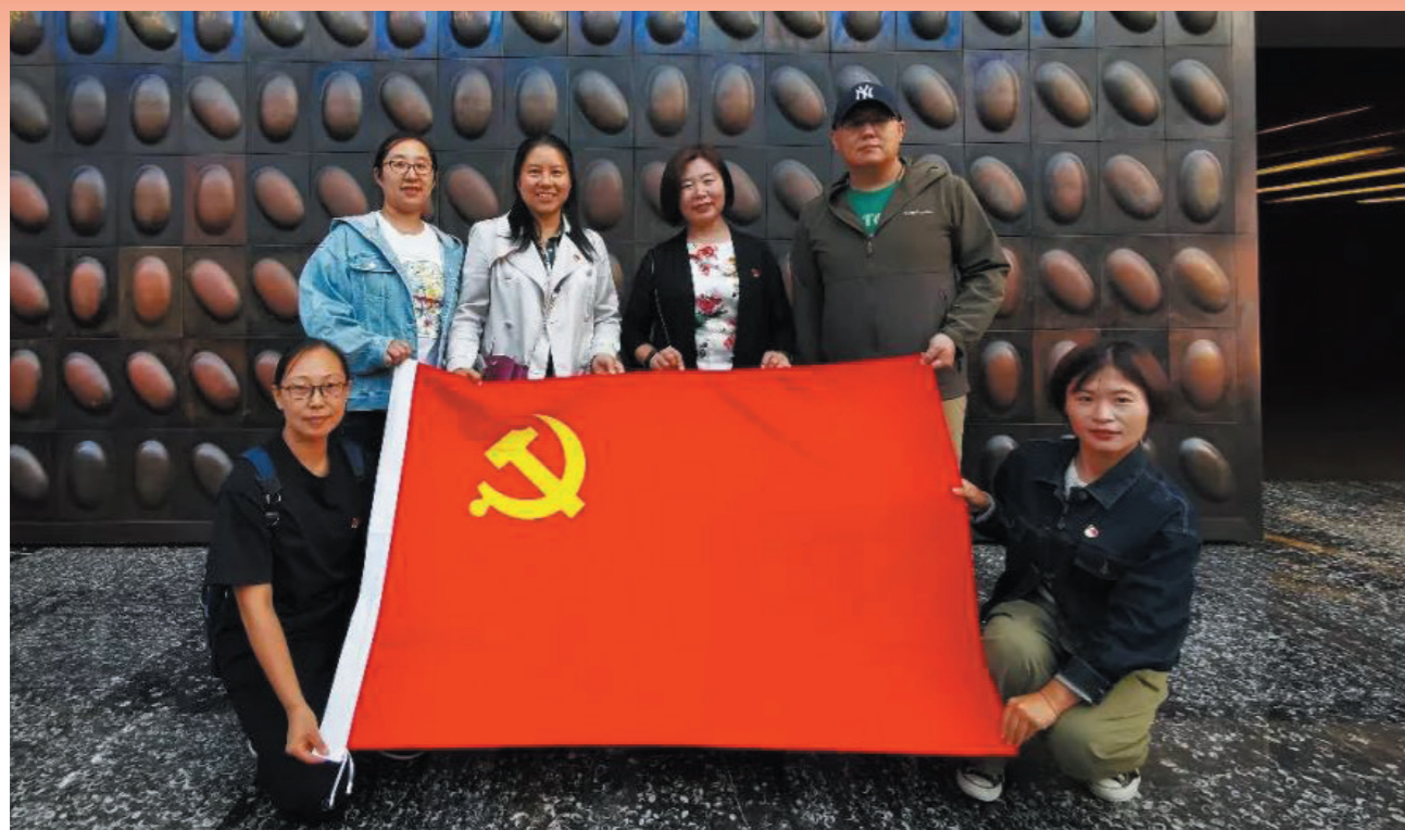
外联处党支部参观国家大剧院