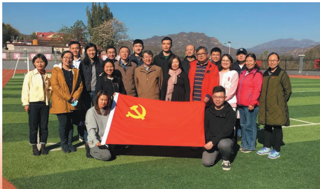
外联处党支部与盈富泰克回访史家寨学校