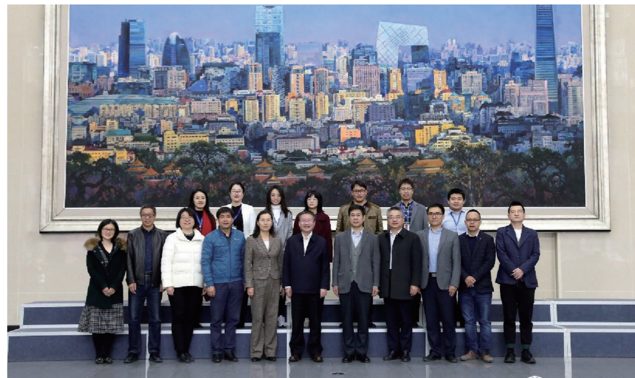
2020年本科人才培养暨一流专业建设研讨会与会人员合影

在这次分享活动中，大家不仅收获了科技教育方面的知识，更大的感受是减少了育儿过程中的焦虑，找到了帮助孩子健康成长的方法。大家像一群探索到新世界的孩子，兴奋地表示期待下一期的分享。