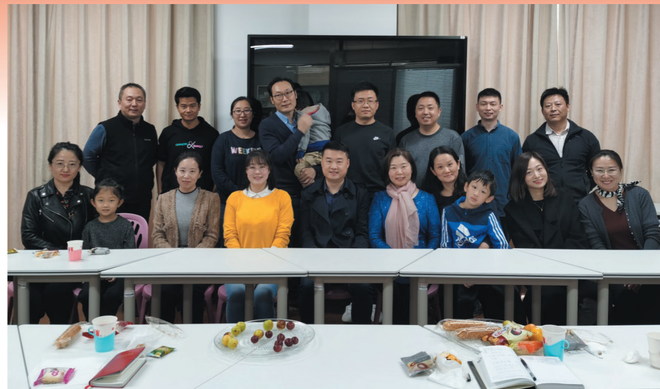
科技育儿知识讲座与会人员合影