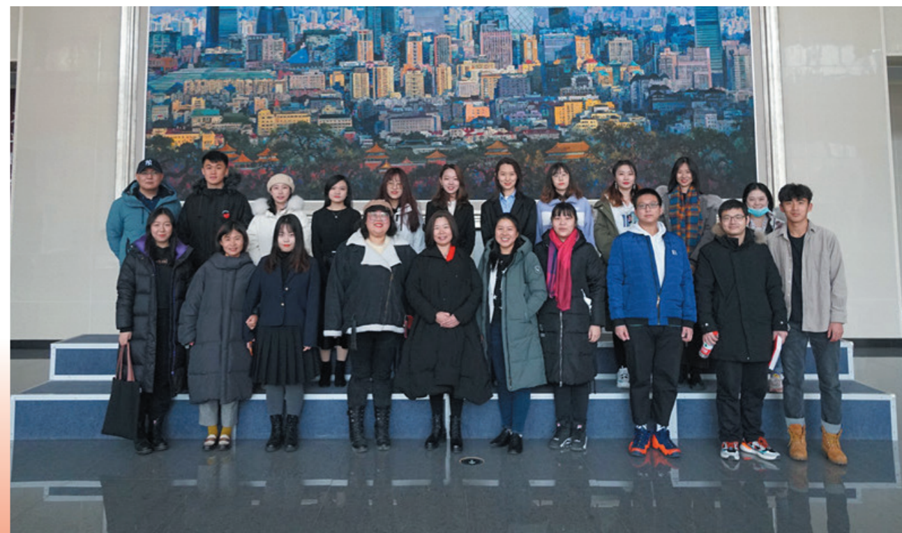
2020届毕业生部分校友联络员合影