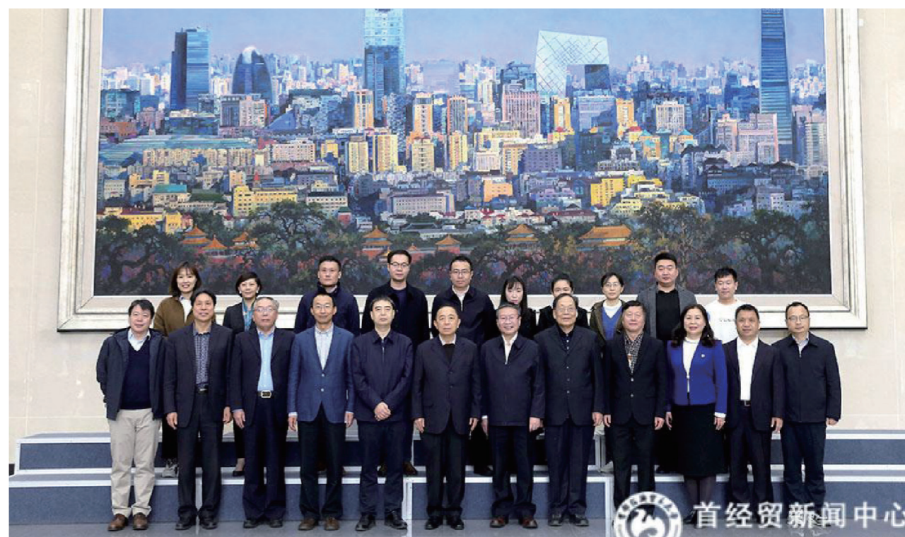
中国劳动学会劳动科学教育分会2020年年会与会人员合影