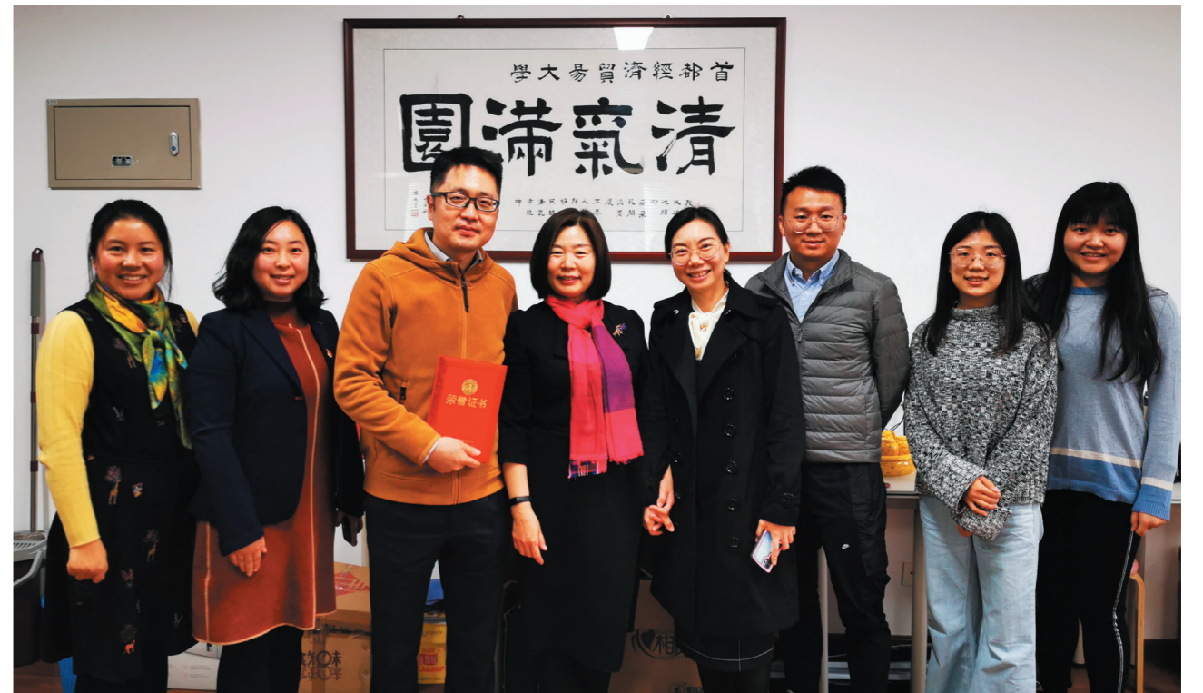
第一创业人力资源部负责人来校洽谈合作