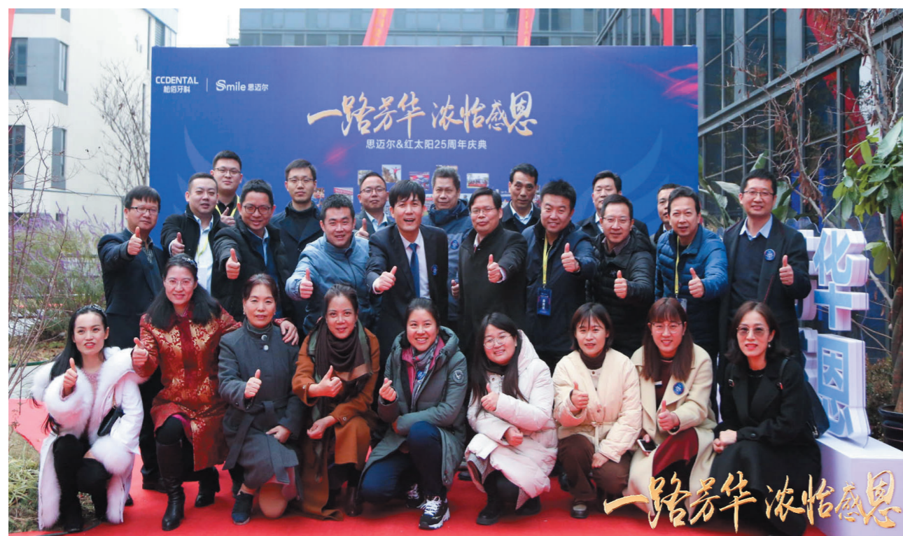
河南校友2020经济论坛与会人员合影