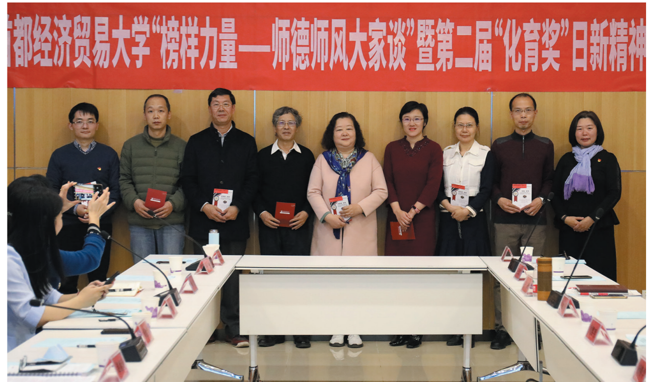
日新奖励基金第二届“化育奖”颁发