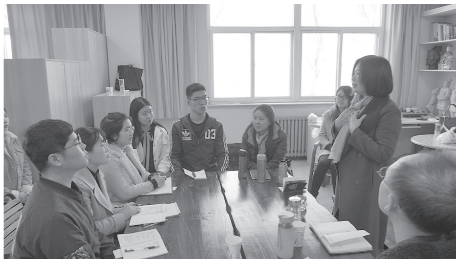
阜平教育扶贫项目—首经贸教育基金会对保定文博学院志愿者进行培训

“大手拉小手”，扶持贫困地区基础教育事业。教育扶贫是阻断贫困代际传递的重要途径，是扶贫助困的治本之策。2018年以来，我校与河北省阜平县教育局合作，对口帮扶阜平史家寨学校，通过首经贸教育基金会搭建的平台，引入优质教育资源和社会帮扶资金，每年投入20万元人民币，用于史家寨学校建设艺术教育课程体系、打造校园文化，着力解决学生创新性思维能力培养、乡村教师专业成长以及学校发展战略和规范管理等问题。经过三年的努力，不仅在学生艺术教育、教师能力提升方面取得了明显成效，还探索形成了一个用少量资金推动四方合作共同促进贫困地区教育事业发展的模式。